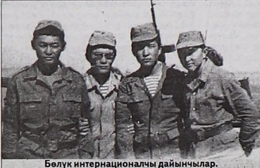
Бөлүк интернационалчы дайынчылар.

чуруунуң чанында авазының шүлүүн база салып каан. Черле ынчаш ол болгаш өске-даа материалдар каада-даа, кандыг-даа чуртка Ада-чурттуң мурнундан дайынчы хүлээлге күүседип чораан оолдарның алдар-ады кажан-даа читпес, уттундурбас, мөңгө деп чүвени чугаалап турду. Музейиниң ажилдакчызы