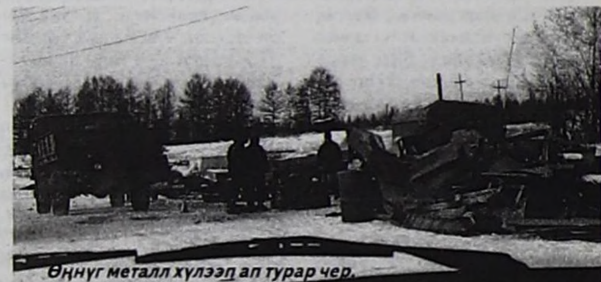
Өңнүг металл хүлээп ап турар чер.

Сайлыг суурга келгеш, сигенширбиилдик бажынарның ховарын кижилер көргөш, мында мал ажылы шоолуг сайзыравайн турар-дыр деп, бодал башка кирер. Ындыг-даа болза амыдырал дээш кызып, эвээш-биче мал азырап турар дузалал ажыл-агыйлыг улус