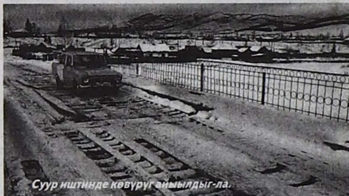
Суур иштинде көвүрүг амылдыг-ла.

ның өөнүн ишти мунуп турары, ол эрткен чылда кандыг-даа шалың чок ажилдааны билдинди. Чайгы июнь-август айларда Кызыл биле суур аразында пассажирлер сөөрткеш, 9800 рубль орулгалыг болган. Ооң-биле дозу саткаш, улуг юбилейлер таварыштыр школының мурнуу талазын ногаан кылдыр будаан. Ол ышкаш уругларның болгаш элээдилерниң спорт школының салбырының крышазын чаар олифа, серебрянка саткан. Артыын (400 рубльди) бир кабинет септелгезинге чарыг-даан. Оон аңгыда чолаачы Өвүрге болгаш Ак-Талче чорук кылгаш, төлевиринге 2 хой алган, ону школының столоваязынга чам кылырынга ажылгаан. Чайгы үеде школының өөреникчилери машинаның кывар-чаар материалдары-