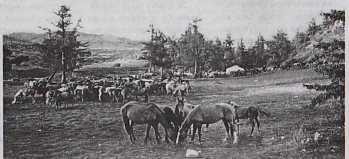
Чылгы — коданында.