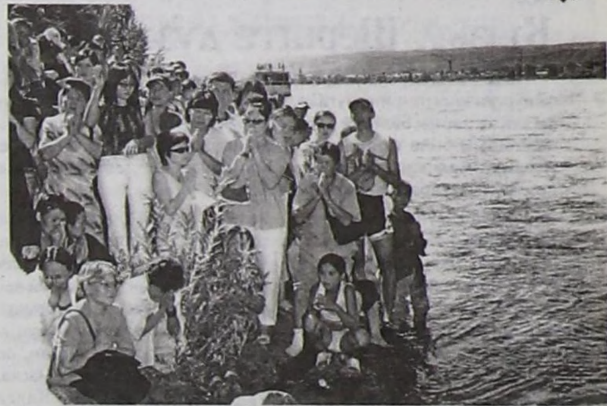
лер, аалчылар киришкен...

Ооң соонда мандаланың алдын элезинин Улуг-Хемче өргүүрүнүң езулалын Азия төвүнүн тураскаалының чанынга, хем кыдыынга эрттирген. Аңаа лама-башкылар, хөй санныг чүдүкчү-