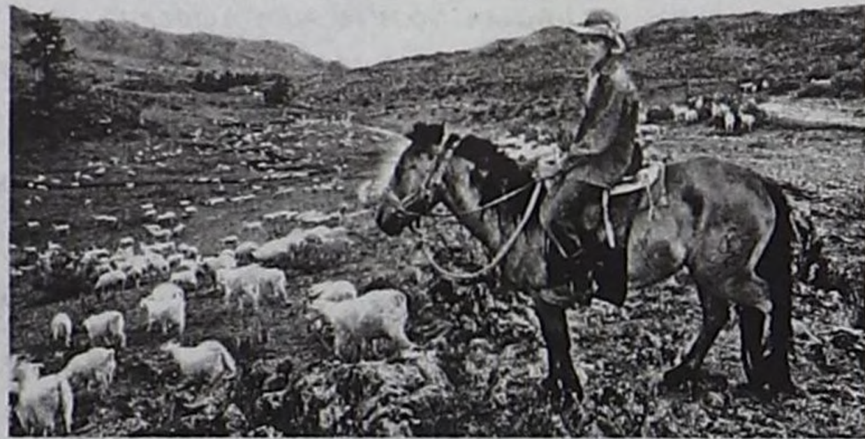
Ымажап Омак — Эрзин школасының 8-кү класының өөреникчизи, малчынарның чайгы дузалакчысы.