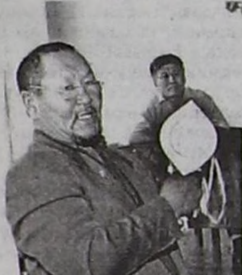
РФ-тиң алдарлыг чурукчузу Киров Хунан.