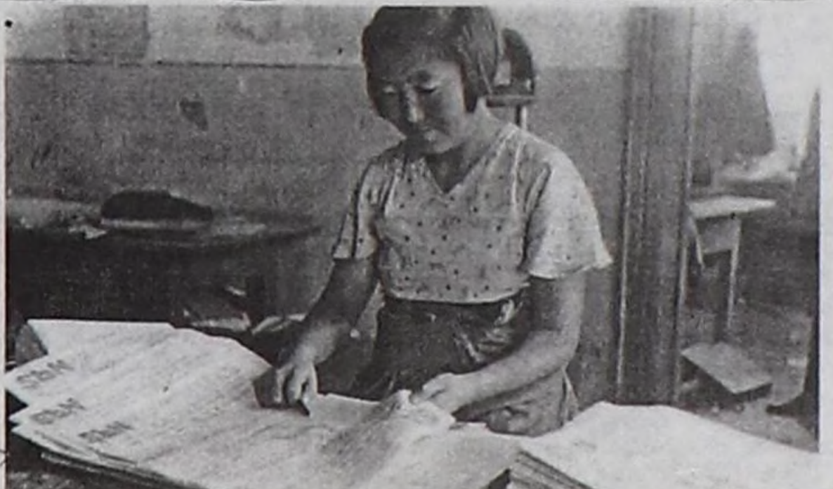
Кызылдың типографиясында “Шын” солунну белеткеп турары.