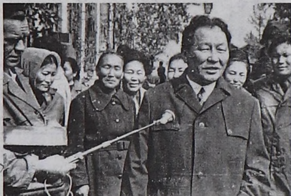
“Шын” солунуң редактору чораан К.С.Шойгу артистер аразында.