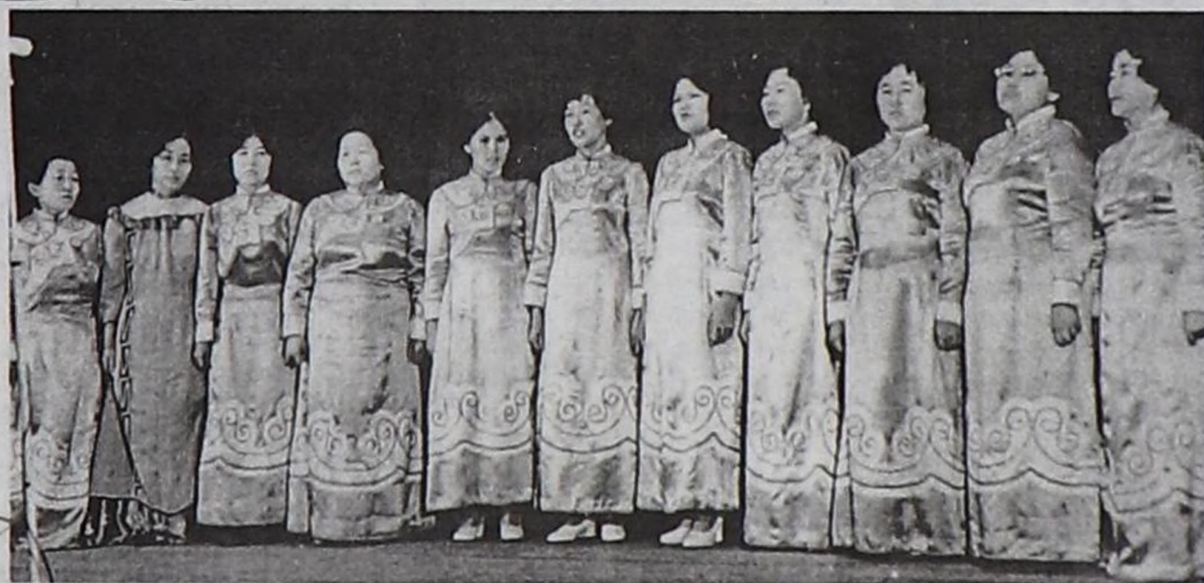
“Шын” солунуң бот-тывынгыр артистери Кызыл хоорайның көрүлдезинде киржип турары.