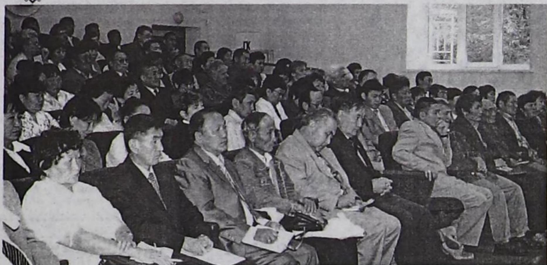
ТР-нің Чазак хуралының ажылының үзінде.