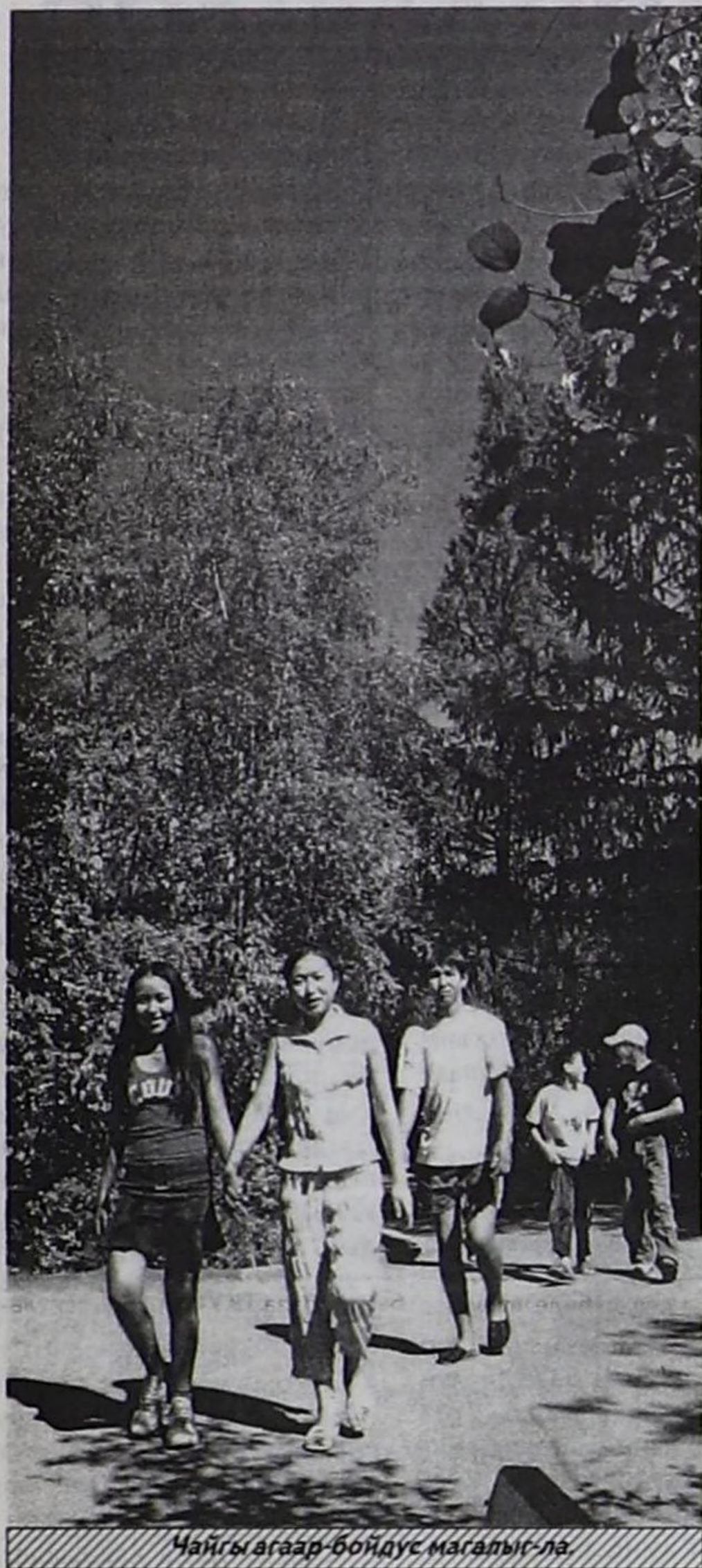
Чайгы агаар бойдуз магалыг-ла.

Каш-ла хонгаш, уругларның чайгы дыштанылгасы төңүп, өөредилге чылы эгелээр. Оларның хөй кезиу дыштанылга лагерлеринге солун, эки чүүлдерге өөренип ап, чаа хөй эш-өөрлерлиг болуп, мага хандыр дыштанганнар. Школачыларның чамдызы бо хонуктарда лагерлерниң сөөлгү сезоннарында дыштанып турарлар.