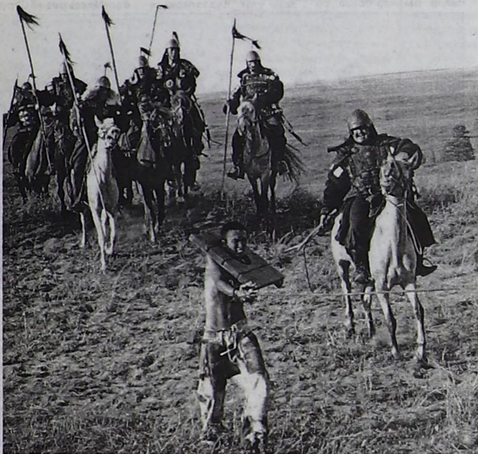
Чалы Тэмуджинни Таргутай-Кирилтук ноянның шериглери тудуп алгаш, сөөртүп алган чорлар.