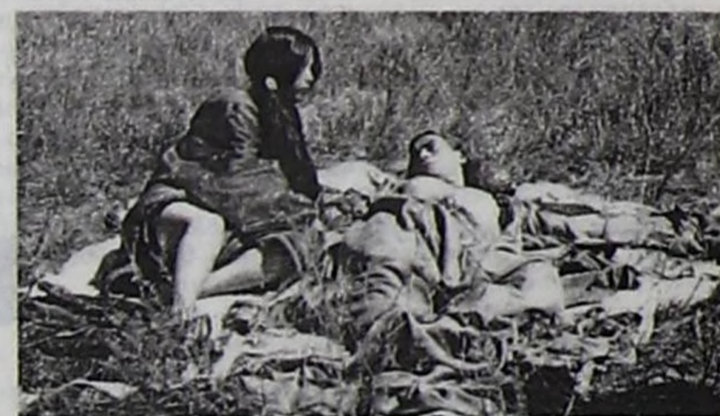
Есугей-Маадыр биле Оэлун кадынның ховуга ужуражылгасы.