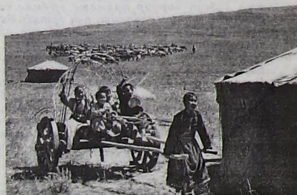
Есугей-Маадырның уруглары ыяш дугуйлуг терге кырында.

Келир чылын Чиңгис-Хаан дугайында кино тырттырар бөлүк бистиң республикавыска ийи ай дургунда ажылдаар. Ол өйдө 2400 шеригниң тулчуушкуннарын тырттырар. Аңаа киржиксээр чылгычылар, аът-хөлдүг аныяк оолдар аът-хөлүн, тыва эзер-чүгенин, харын-даа куяк хеп-даа болза чогаадыкчы езу-