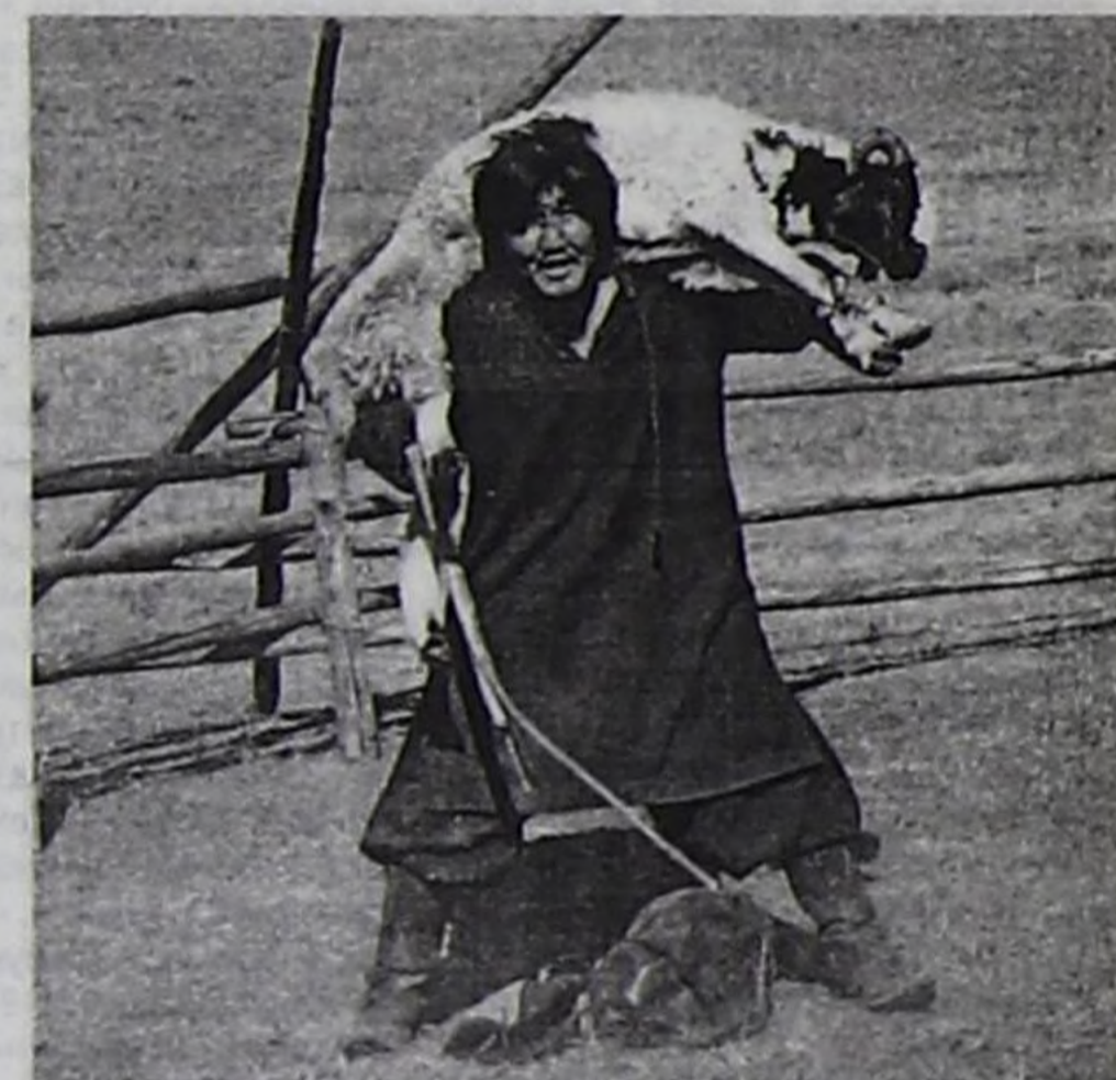
Таргутаи-Кирилтух ноян (артист П. Садовников) ирт чүктеп алган.