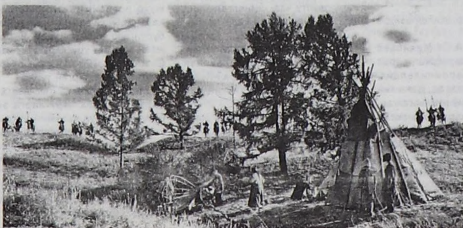
Шериглер чадырны бүззөлепкен.