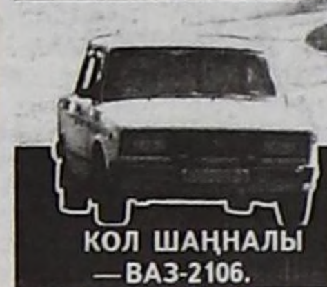
КОЛ ШАҢНАЛЫ — ВАЗ-2106.

2005 чылдың май 9-та «Хүреш» стадионунга «Шын» солуннуң шаңналы дээш национал тыва хүрештиң чаңчыл болган маргылдаазын бо чылын Ада-чурттуң Улуг дайынынга Тиилелгениң 60 чылынга, «Шын» солуннуң баштайгы номериниң чырыкче үнгениниң 80 чылынга тураскаадып эрттирер.