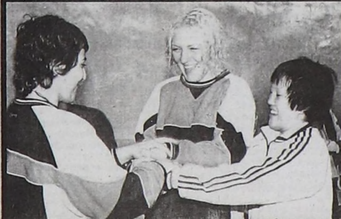
Маргылдааның тиелекчилери.