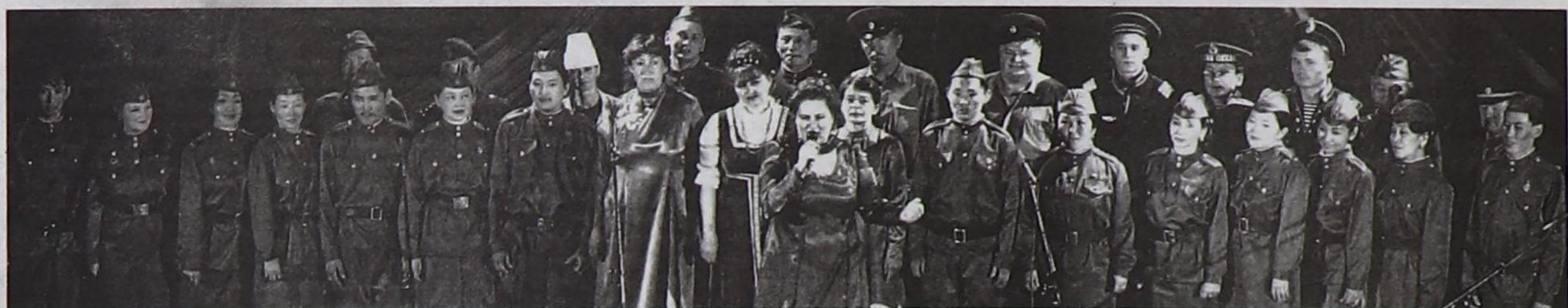
Тожу. «Май Вальзы».