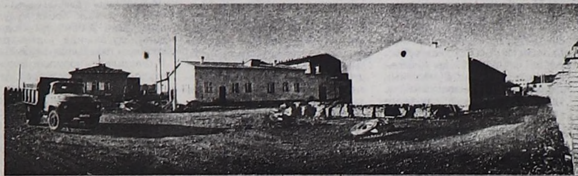
Акшалаандырыышкын чогуңдан ажылгалга кирбейн турар халдавырлыг аарыггар эмнелгезиниң ийи объектиси.