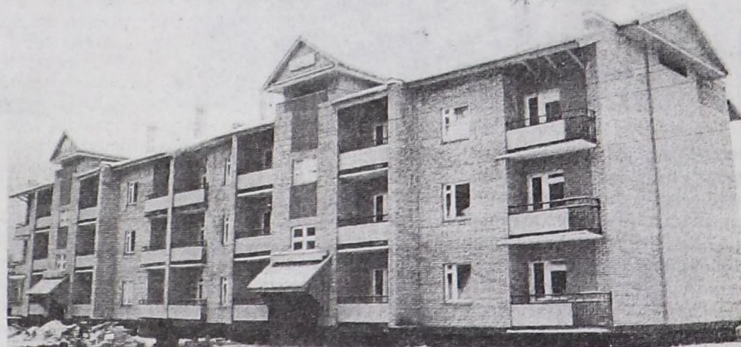
Кызыл хоорайның Пушкин кудумчузунда 16 аал чурттаар чуртталга бажыңы.