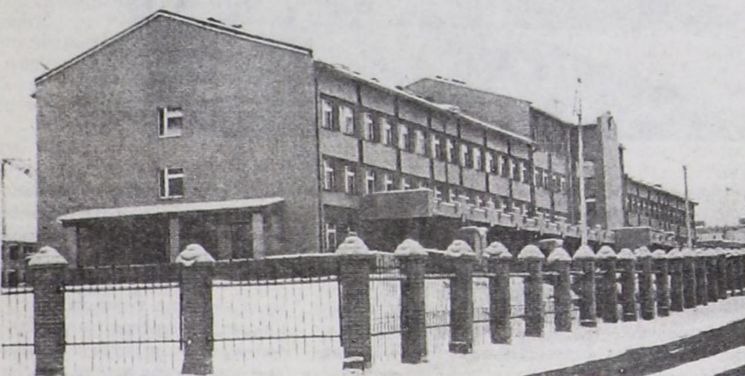
Ажыгалга кирип турар республиканың халдавырлыг аарыглар эмнелгези.