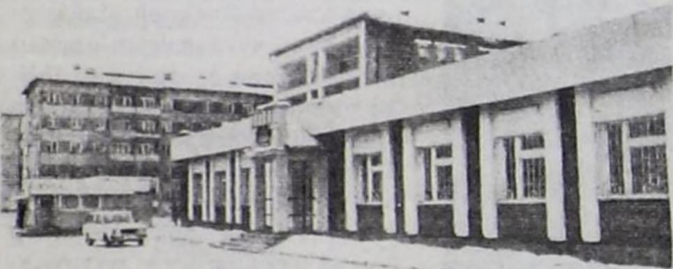
Кызыл хоорайда 1000 санныг АТС-6.