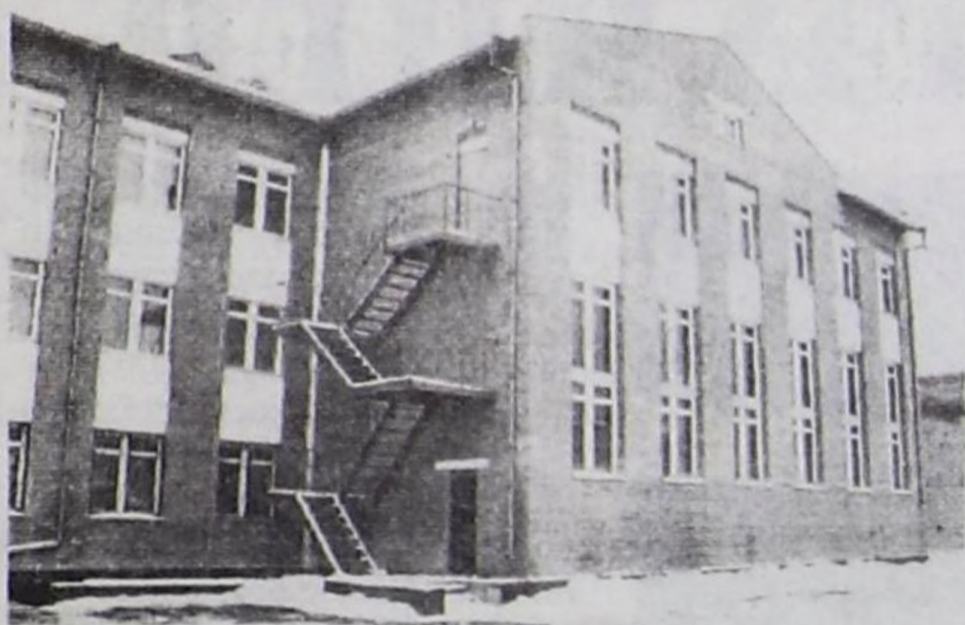
Кызыл хоорайда күрүне лицейиниң ажыгалга кирген чаа бажыңы.