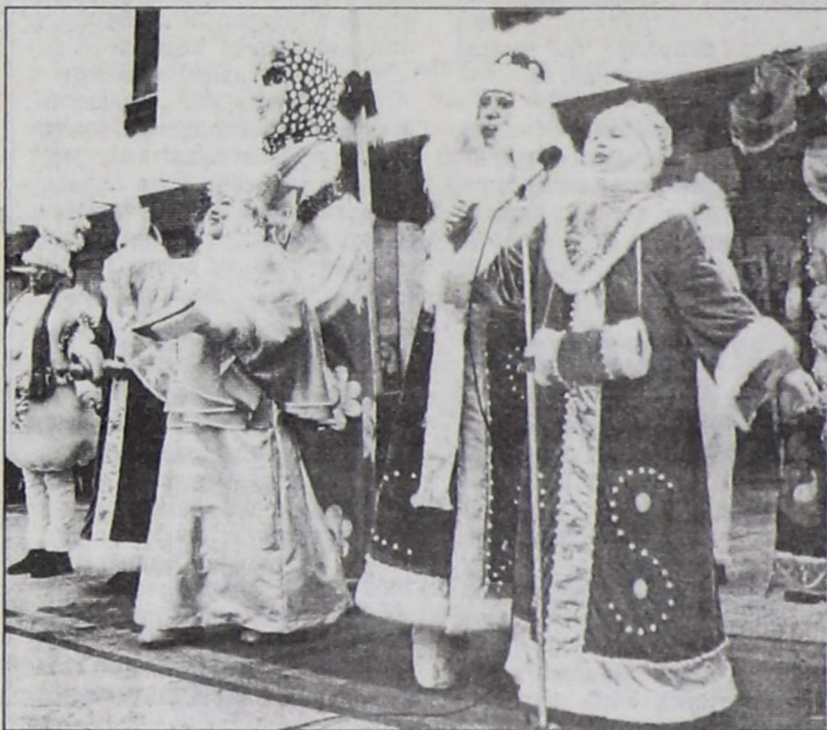
Чаа чылда Арат шөлүңге