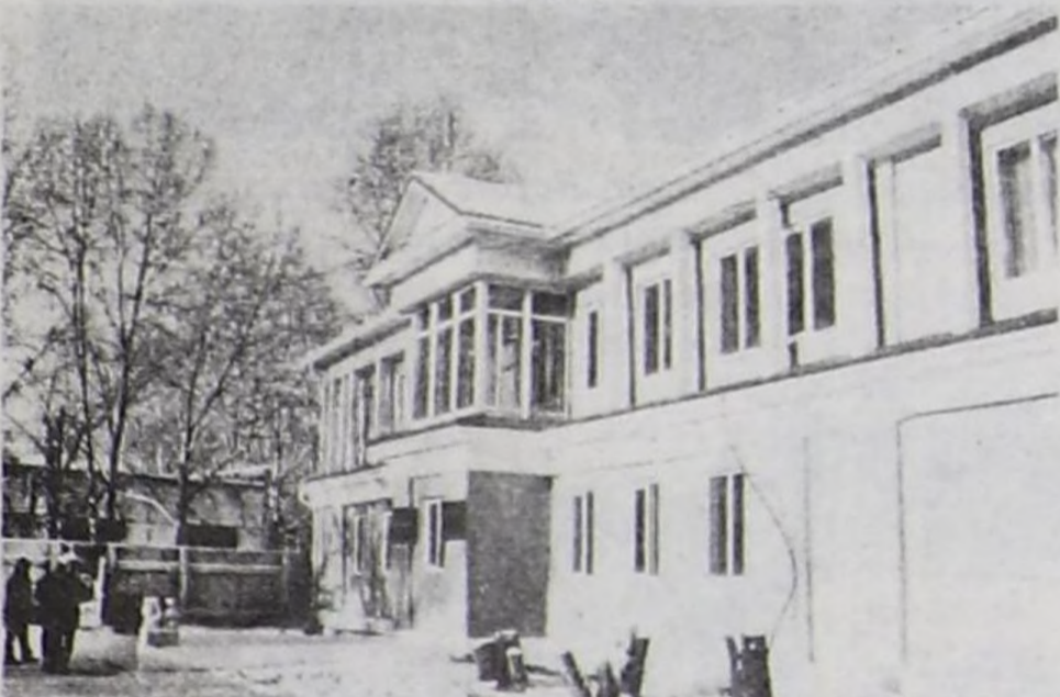
ТР-ниң башкылар билии бедидер институтунуң чаа хевири.