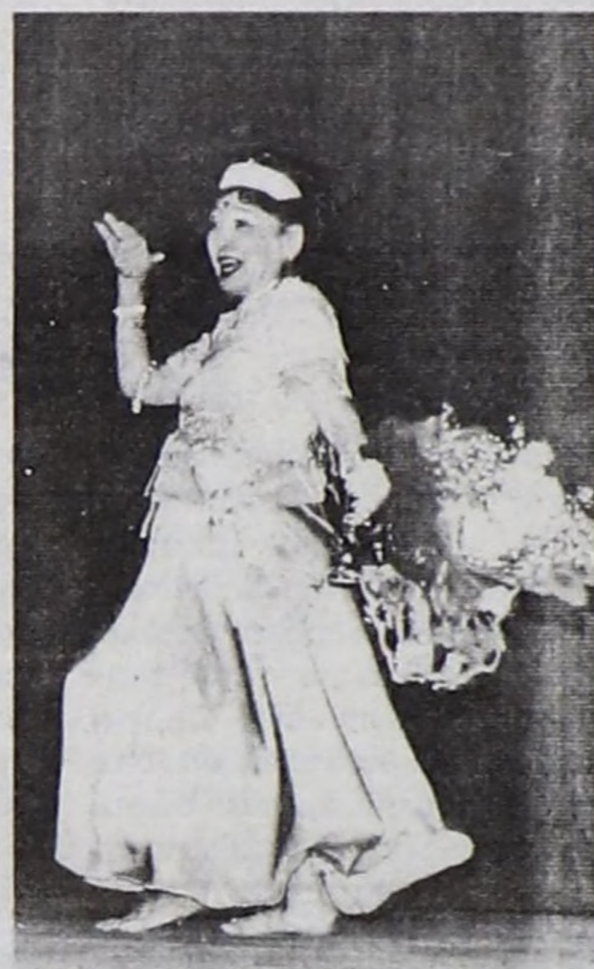
"Индий кино сылдызы" Ч.С.Кыргыз.