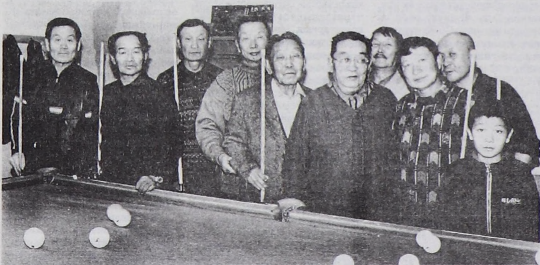
Хоочун бильярд ойнакчылары.

Баштайгы Кыдат бильярд Европага 15-16 вектерде, а Россияга бильярд Петр I хаан үезинде көстүп келген. Ол Голландияга чорааш, бир дугаар оон-биле таньшкан соонда, ол хаанның ынак оюннарының бирээзи апарган. Бильярд бодунун сайзыралының эгезин Франция биле Англияга алгаш, Россияга оон-даа улуг хөгжүлдени алган.