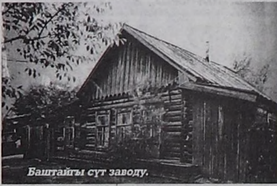
Баштайгы сүт заводу.