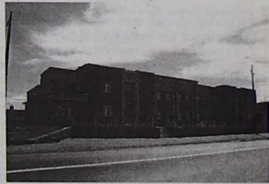
Удава ажылгалга кыер кондитерлик кылыглар фабрикасы.

1973 чылга чедир республиканың малын Хакасияның найысылалы Абакан хоорайның эът комбинатында дужаап турган, ынаар дужаар малды Шивилиниң база Сүт-Хөлдүн Көжээ баа-