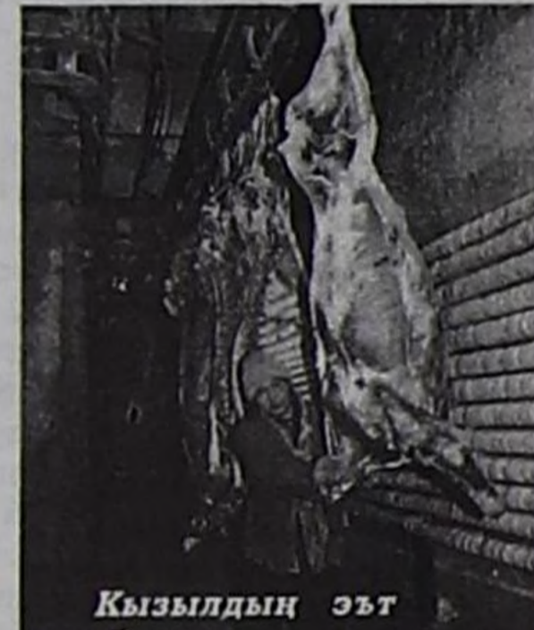
Кызылдың эът комбинаты.

ТР-ниң Чазаа, оң Даргазы Ш.Д.Ооржак республиканың аш-чем болбаазырадыр бүдүрүлгелериниң келир үезинче улуг кичээңгейни салып турар.