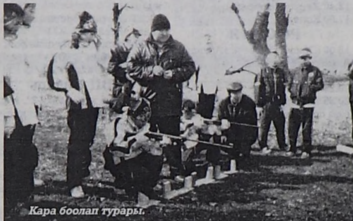
Кара боолап турары.

Тываның мурнуу зоназының школаларының маргылдаазын Сукпак школазының баазазынга эрттирген. Орта ниитизи-биле он