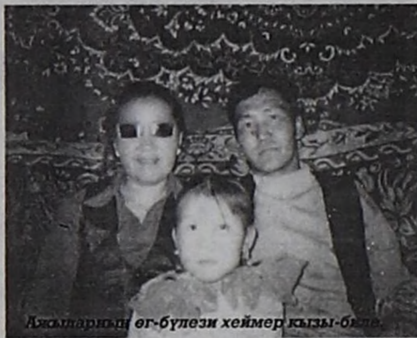
Ажыларның өг-бүлөзи хөймер кызы-биле.