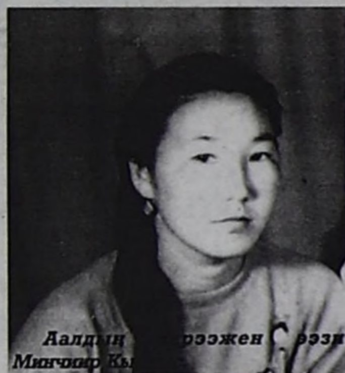
Аалдын ээзи Минчиер Кы...

харлыг, ам-даа хуу малын кадарып малчыннап чоруур.