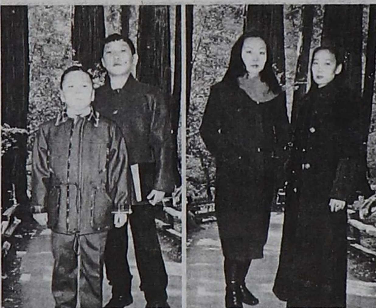
Даараан хептерниң көрүлдези.