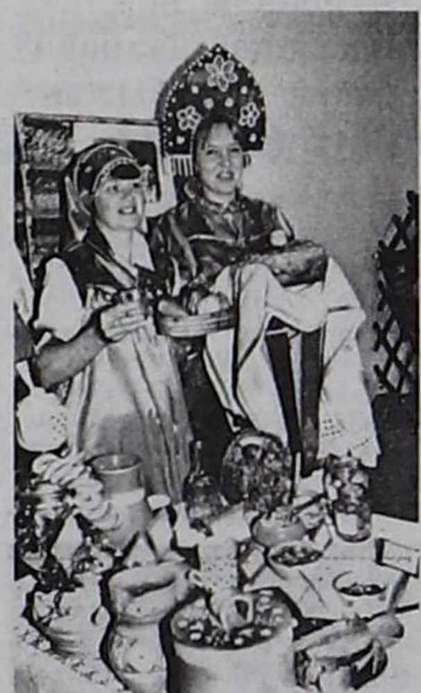
Бии-Хем кожунунун төлээлери.

руурлар. Чоокку үеден бээр бистиң аравыста харылзаа шуудай бээр дээрзинге бүзүрээр мен. Бисте ам безин тыва студентилер өөренип турар болгай, аравыста садыглажылга харылзаазы база