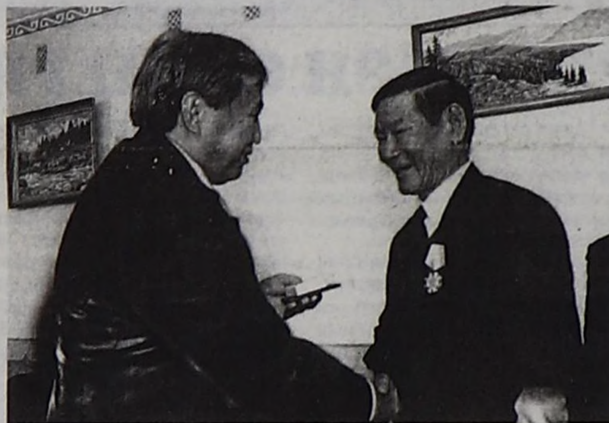
Ш.Д.Ооржактың Тыва Республиканың Орденин Д.Пунцагга тывыскап турары.

сөс алгаш, ооң күш-ажылын үнелеп көргөш, республиканың дээди шаңналын тывысканы дээш ТР-ниң Чазаанга улуу-биле өөрүп четтиргенин илереткен. Россия-моол кады ажылдажылганы хөгжүдөр, улустарның аразында найыралды харылзааларны калбартыр, быжыглаар дээш Тыва Республиканың Чазаа-биле бир демниг ажылдаанын, Моолдун Кызылда Чингине консулунун ажылынга деткимче, дузаны Чазак Даргазы Ш.Д.Ооржак доктаамал чедирип келгенин ол демдеглээн. Ооң ачызында кылыр ужурлуг ажылдар, шиитпирлээр айтырылгар амьщыралда боттанып турарын консул