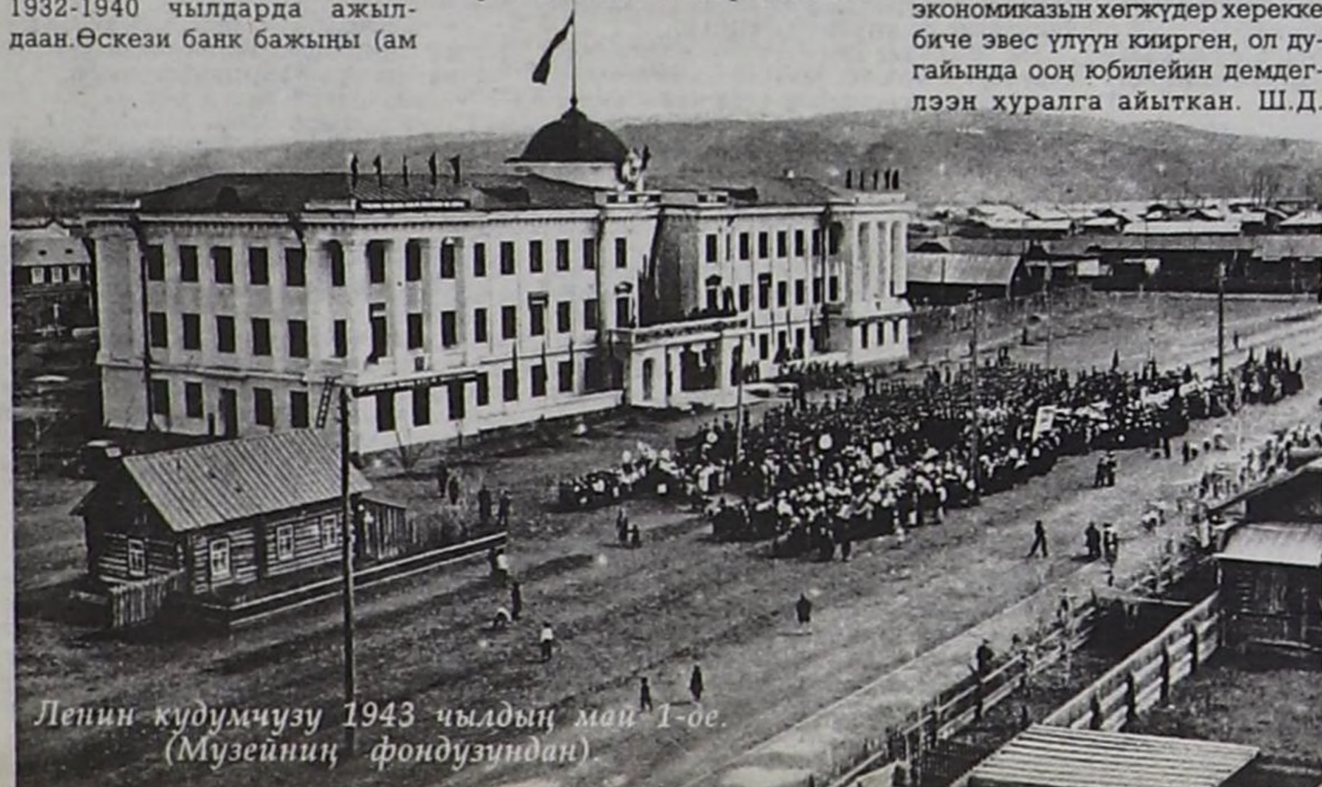
Ленин кудумчузу 1943 чылдың май 1-де. (Музейниң фондузундан)

Россияның составына Тываның каттышканының соонда Тываның политиктиг, социал-экономиктиг амьдыралына хамаарышкан күрүне уjur-дузалыг документилер хүлээп алыр болгаш чугула болуушкуннар бо кудумчуга болгулаан. 1992 чылдың сентябрь 19 Тываның төөгүзүңгө онзагай хүн болуп арткан. Сарыг шажынның шылгаңгай баштыны, Нобель шаандалдың эдилекчизи XIV Чырыткылыг Далай-лама Башкы Тывага албан езузу-биле ол хүн келген. Ленин кудумчузунуң Арат шөлүңгө муң-муң кызыл чылар болгаш найысылалдың аалчылары чыылган, олар Улуг Башкыны улуг хүндүткөл-биле