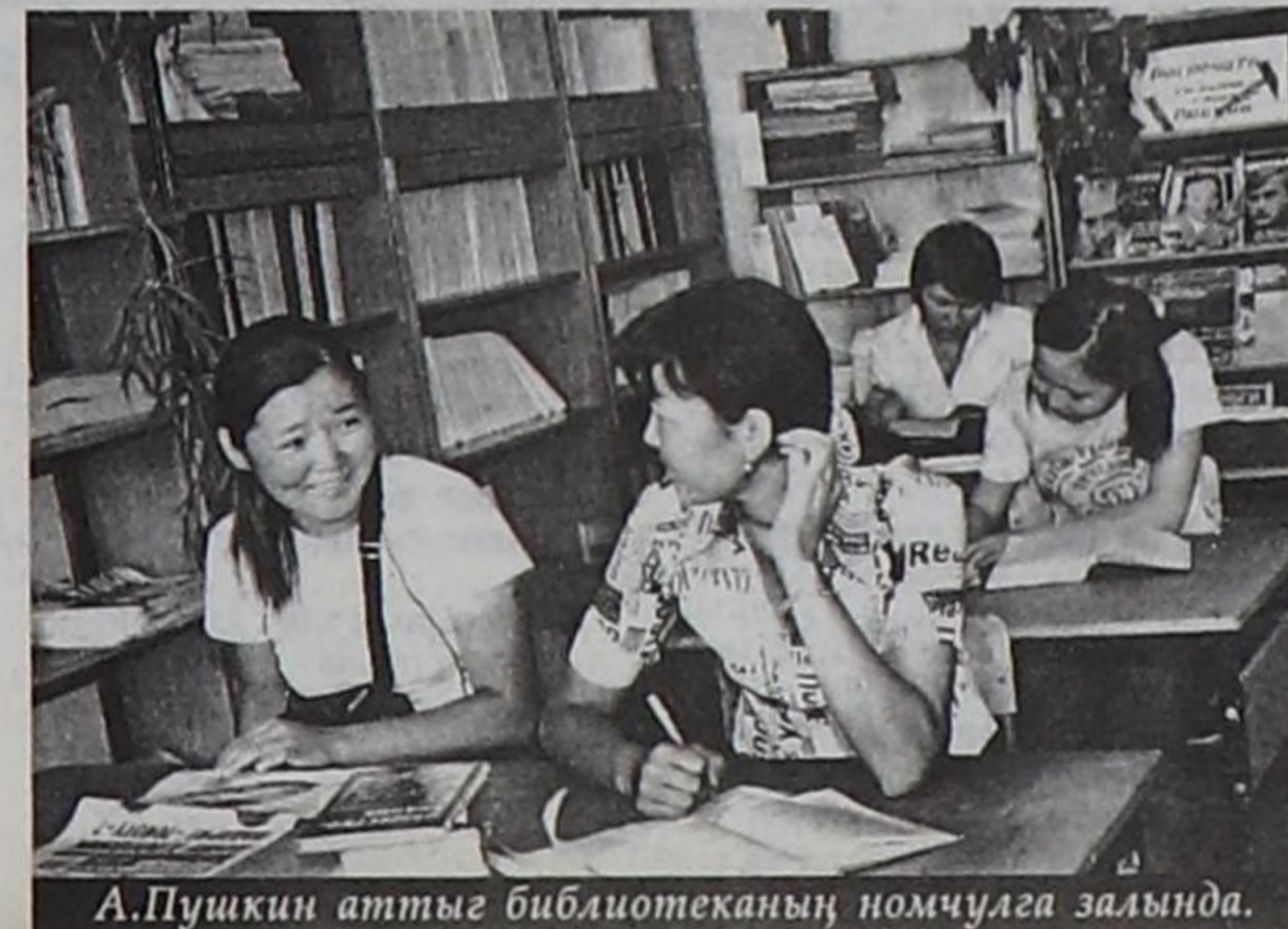
А.Пушкин аттыг библиотеканың номчулга залында.