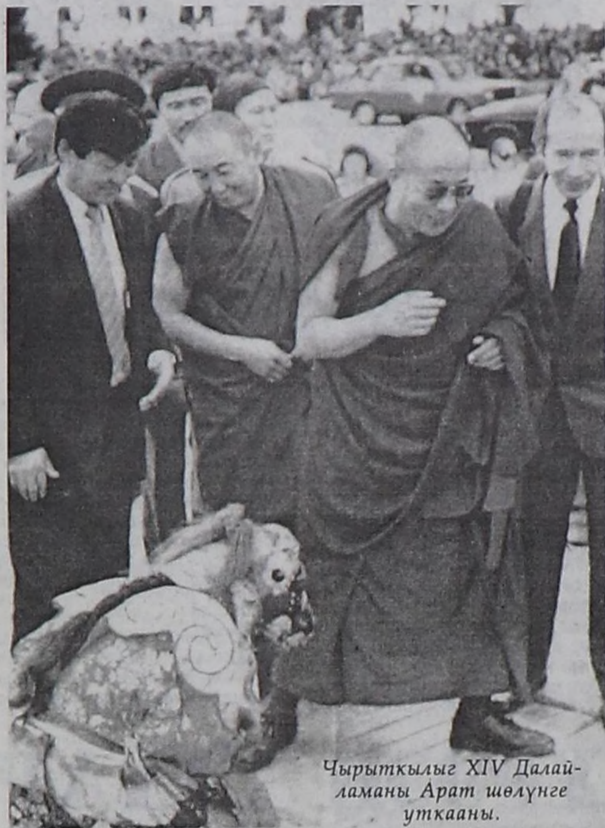
Чырыткылыг XIV Далай-ламань Арат шөлүгө уткааны.

жынның номналын непередиринге улуг рольду ойнаан.