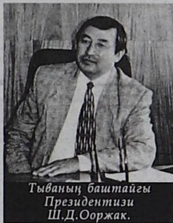
Тываның баштайгы Президентизи Ш.Д. Ооржак.

йрлалдарга, болуушкуннарга тураскааткан чоннуң чыскаалдары, митингилери ТАР үезинден бээр болуп турган. Тываның Россияның составына эки тура-биле 1944 чылдың октябрь 11-де каттышкан хүнүнге тураскааткан митинг-чыскаалды Кызылга эрттирген. Май бириниң, Октябрь революциязының байырлалдарына тураскааткан хөй кижжи киржикчилиги, күчүлүг чыскаалдар бо кудумчуга болуп турганын оларның киржикчилери ам-даа утпаан. Чуртка демократтыг чаартылгалар, өскерилгелер болган соонда сөөлгү чылдарда бо кудумчуга чыскаалдар болбаастаан. Россияның бот-дугуннаанын чарлаан хүнү — июнь 12-ни байырлал хүнү кылдыр чарлаан. 2003 чылдан бээр ону Россияга калбаа-биле демдеглээр болу берген. Орта тураскааткан Кызыл хоорайның коллективтериниң, чонунуң хөй кижжи киржикчилиги чыскаалы бо чылдың июнь 12-де бир дугаар болуп эрткен.