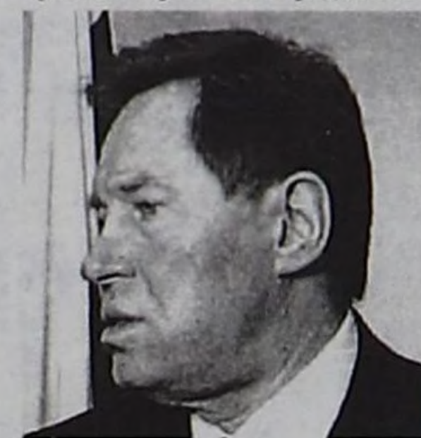
Регионалдыг болгаш национал политика херектеринин талазы-биле чаа сайыт Владимир ЯКОВЛЕВ

херек, чурттун чааа-даа, яамылар, ведомстволар-даа, Россия Федерациязынын субъектилериде база тус-тус черлерин эрге-чагыргалары-даа ындыг планнарлыг турар ужурлуг. Бо бүгү айтырылгар комплекзинин ажылдап кылышыкынын Россия Федерациязынын Президентиниң тускай чарлыгына үндезилеп