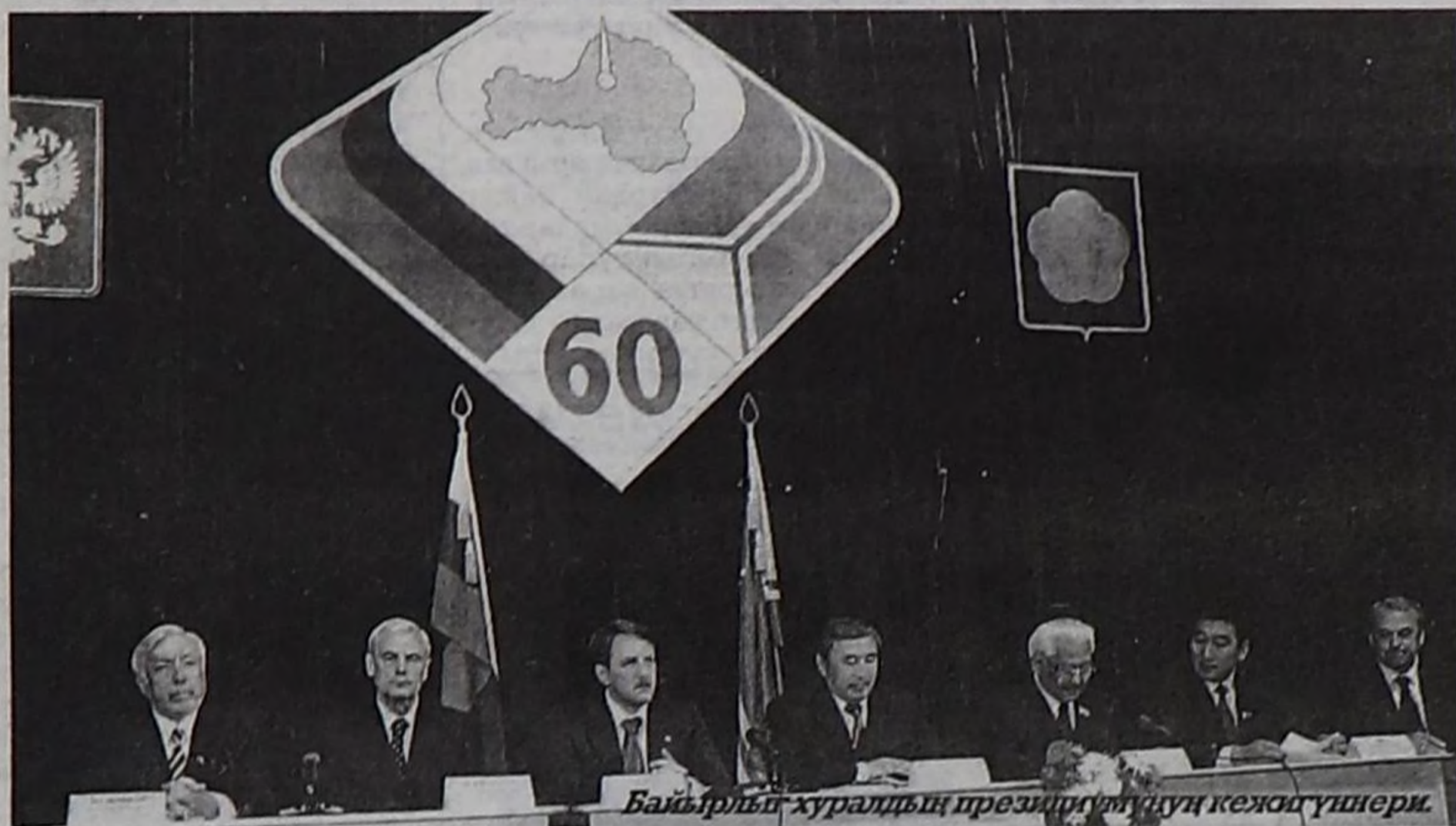
Байырлыг хуралдың президенттин кези үшери.

Республиканың В.Көк-оол аттыг хөгжүм-шии театрының даштын казангызындан-даа артык каастап-шимээн. Ооң мурнуу талазында «Россия биле Тыва 60» деп улуг үжүктөр-биле бижээн ханы