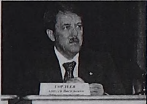
РФ-тиң көдээ ажыл-агый сайыды, федералдыг Оргкомитеттин даргазы А.В.Гордеев.

Республикада туттунуп турар аэровокзал, кондитер фабриказы, гостиница, православ шажын хүрээзи дээш, оон-даа өске объектилерни сайыт чүгүле экономикаже үлүг-хуу база эвес,