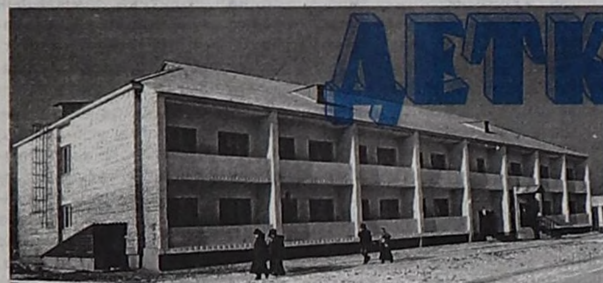
Хоочуннар бажыңында немелде тудуг.

Президиум хуралы өлген кижилерниң төрелдеринге ханы кажыдалды илгерилээн, Профэвилелдериниң федерациязы, ооң адырлар аайы-биле комитеттери, бүгү эге организациялары когарааннарга дуза чедирери-биле банкыда ажиткан агар санче акша шилчидерин шиитпирлээн. А агар сан чок эге организациялар профэвилел дузаламчызын ажил берикчилериниң агар саннарын дамчыштыр шилчидер.