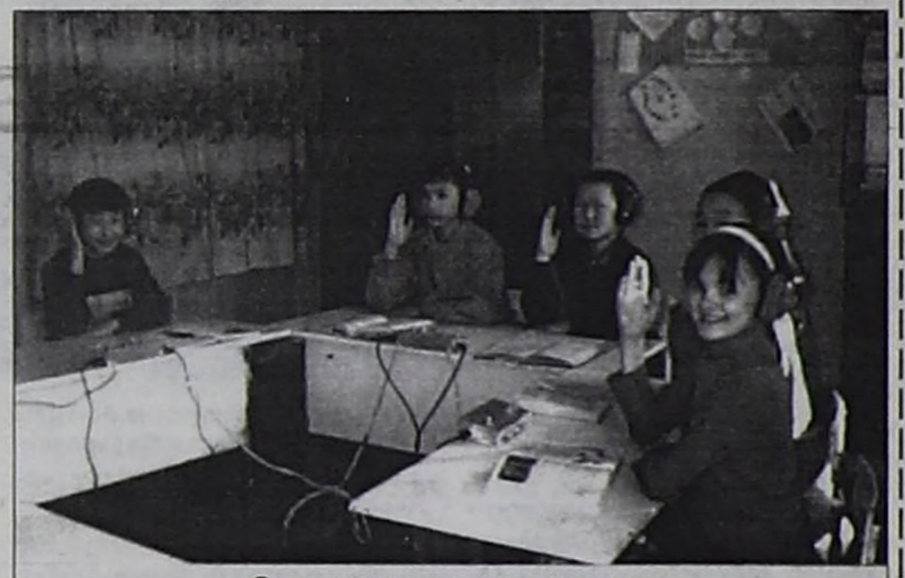
Өөреникчилер кичээл үезинде.

Өөреникчилер кайгамчык салым-чаянныг, спортка, уран чүүлге сундулуг. Бичини класстар-