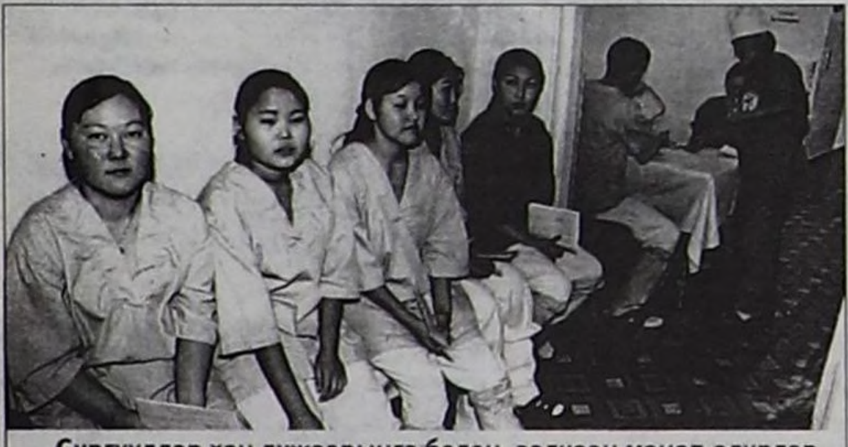
Сургуулдар хан дужаарына белең, ээлчээн манап олурлар.

Республиканың хан солустур кудар станциязында бо хүннерде регистратурадан эгелээш коридор долдур хан дужаары-биле оочурлаан чон эндерилген. Олар дээрге өрт айылынга таварышканнарга боттарының ачы-дузанын эки туразы-биле чедирип турарлары ол.