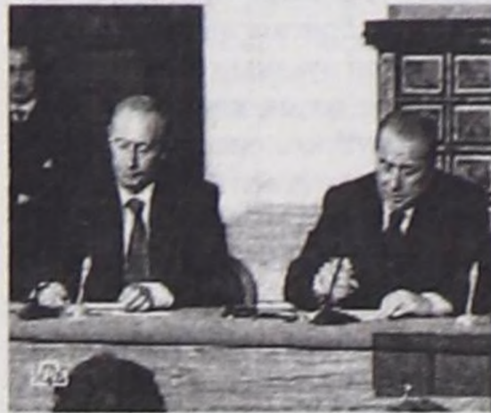
Вторникте РФ-тин Президентизи Владимир Путин Италияның Сайыттар Чөвүлелиниң даргазы Сильвио

— Аппарат ажилы чүглө Отчет таныштырылганын биле доозулбас. Бистин бо, шынап-ла, чымыштыг ажилымыс хүн бүрү уламчылаар, дыштаныр дыш-даа уттундурар чүве бо. Чазактың хүн бүрү ажилын хандыраы бистин «мойнувуста» — хуралдаар өрээлдерни белеткээр, ооң чорудулганын харылаар дээш, оон-даа өске ажилдарымыс хөй. Чаңгыс сөс-биле, Чазак Аппарады ажил-агытты айтырыгларны бүрүнү-биле харылаар эргелел-дир ийин.