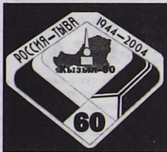
(Төңгүзү. Эгези № 76 "Шында").

Тываның Россияга каттышка-нын соонда Хадың суурнуң, Кочетов аттыг колхозтун, чоок-кавының арааттарының амыдыралына өскерилгелер чоорту болуп эгелээн. Тыва арааттар колхозка демниң-биле кирип, коллективтиг ажил-агый бооп ажилдаарына улуг күзелин илередип турганнар. Мээң ада-иём база-ла өске эш-өөрүндөн чыдып калбааннар. Колхоз хуралына барып олуржуу-биле бир-ле кежээ ачам Хадыңче чоктапкан. Хурал даңны атсы, хүннү бадыр үргүлчүлээн хире, чүге дээрге ачам чүгле даартазында кежээликтей чанып келген.