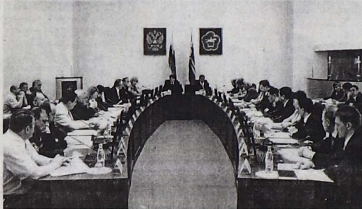
Федералдыг оргкомитеттин хуралы.

Тываның Россияның составына каттышканының 60 чылына болгаш Кызылдың тургустунганының 90 чылына турсааткан байырлалдарны федералдыг деңгелге эрттирер дугайында РФ-тиң Президентизи В.В. Путин Чарлыкка ат салган, ынангаш бо байырлалдарны политиктиг улуг ужурашканы болуп турарына А.В. Гордеев чугаазына демдеглээн. Байырлалдарны бедик деңгелге эрттирери-биле белеткелдерни кончуг хынамчалыг, бодамчалыг, харыс-салгалыг чорудуп турар. Чүге дээрже республиканың бурунгаар хөг-