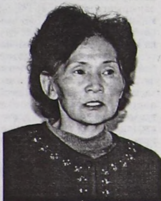
Ыяап-ла медицина камгаладылгазының талазы-биле фондунун төлээлери кожууннар бүрүзүнде ажылдап турар.

улуска дузалаарының аргаларын тывар апаар. Ажылдавайн турар чурттакчы чонга медицина талазы-биле ыяап-ла камгаладылга девискээр фондузунче күүсекчи эрге-чагырга органның чылда дадывыры 1030 муң рубль, айда — 84 муң рубль. Ол акшаны кожуунун саң-хөө килдизи 3 ай ишти төлөвейн турар. Эмнелге черлери эм-дом чээр ужурга таварып турар. Ажылдавайн турар чурттакчы чоннуң медицина талазы-биле ыяап-ла камгаладылгазына чедир төлөвээн дадывыры, хөөлери болгаш торгаалдары 450 муң рубль чедип турар.