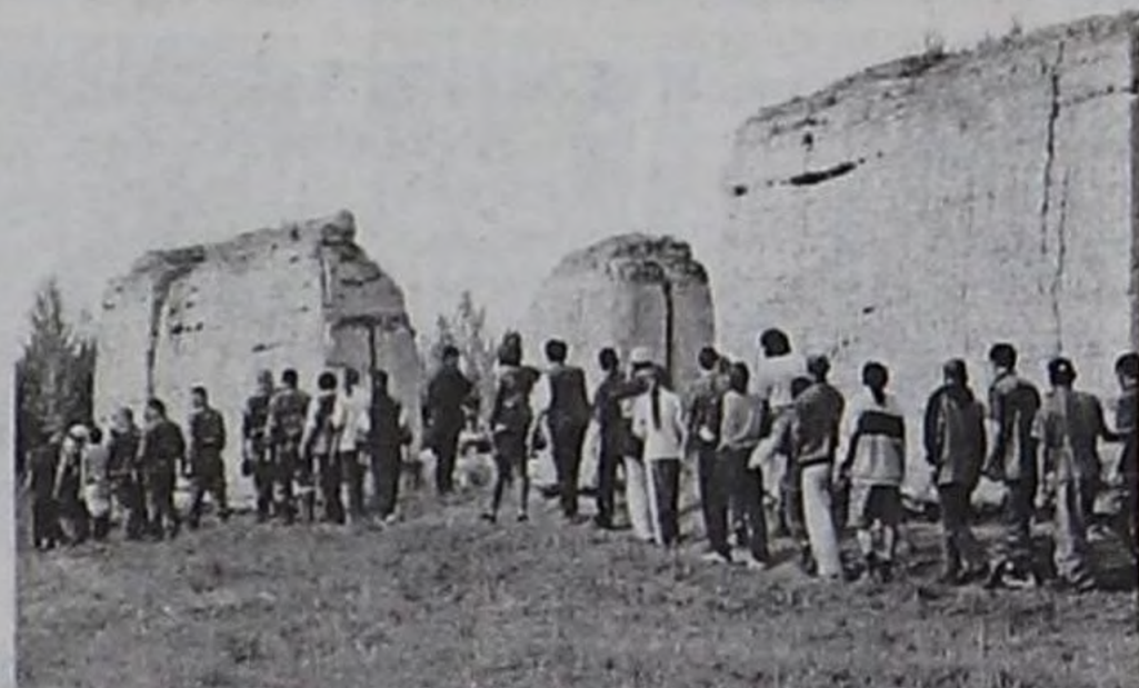
Фестиваль чылар — Устүү-Хүрээде.