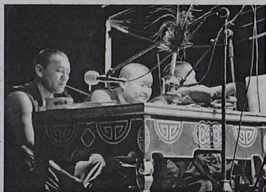
Цэченлинг хүрээниң башкылары мөргүл үезинде.