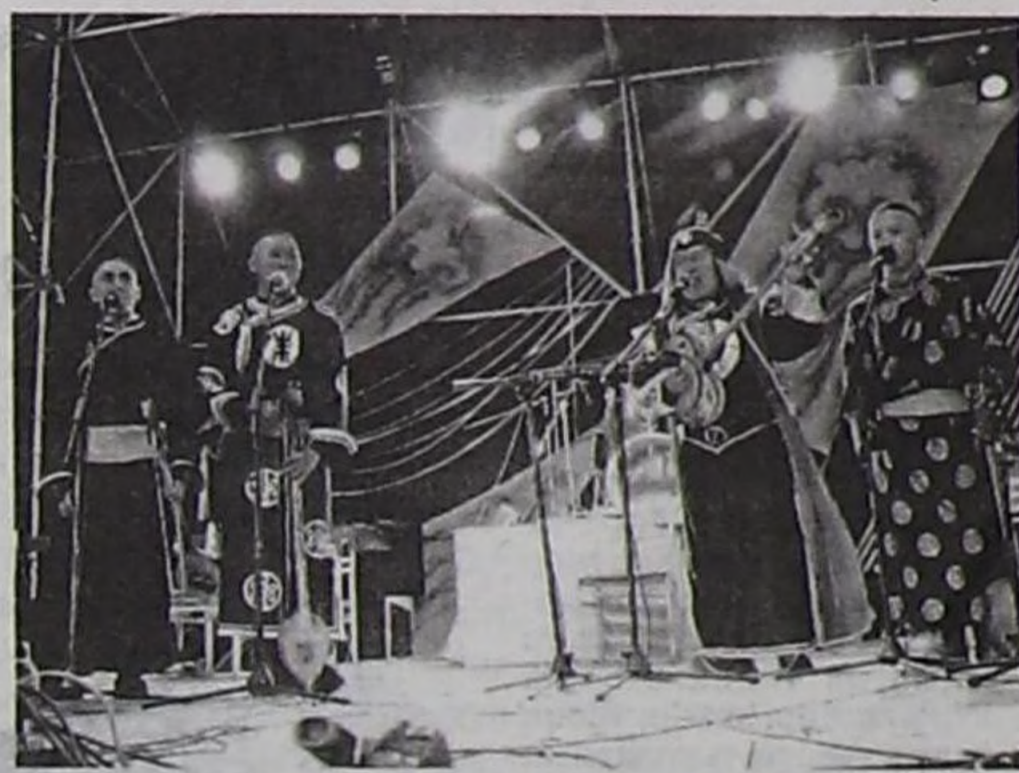
Тиилелгелиг «Алаш» бөлүү.