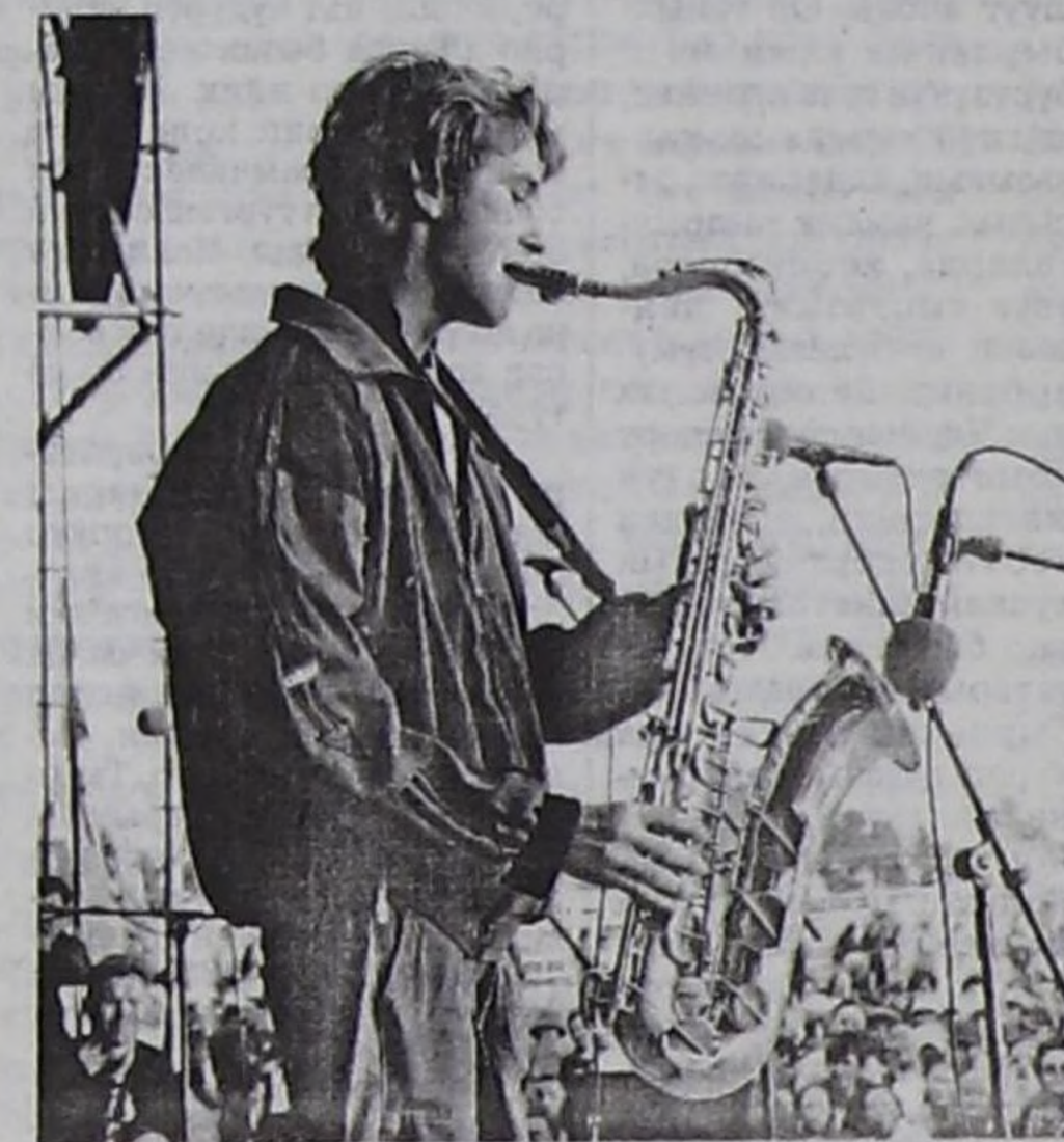
«Хөлбөң шыктыг Чадаанага Хөгжүм салып ойнаксаар мен».