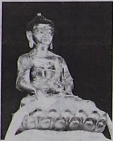
(Уланчызы, Эгзи 1-ги артында).

Алды-Хүрээ. Бетин талазында өң-баазын майгын-хоорай, ындында – делгем, каас сцена. Фестивальдың чаңчыл болган байырлыг чыскаалы эгелзэн. Цэченлинг хүрээниң лама башкыларының соо-биле даргалар, боттарының янзы-бүрү национал идик-хевин кеткен хөгжүмчүлөр – мөөрейниң киржикчилери уран чүүл училищезиниң үрер хөгжүм оркестриниң үделгези-биле хоорайже үнүптү. «КамАЗ» кырын концерт шөлү кылган чыскаал-биле хөй чоннуң көжүп кел чорууру — фестивалдың чыл келген тудум сайзырап олурарын херечилээр.