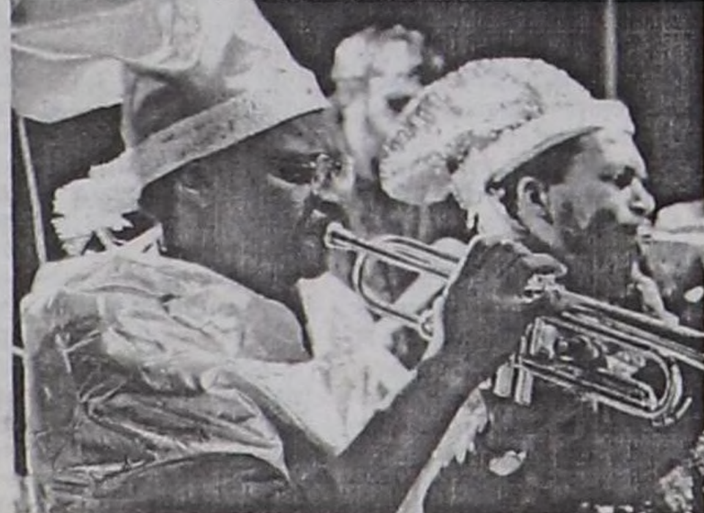
«Сан-Ра» (АКШ) аян тудуп тур.