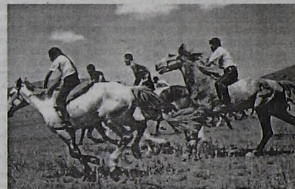
«Аксым сал дээр чүтүрүктөр».