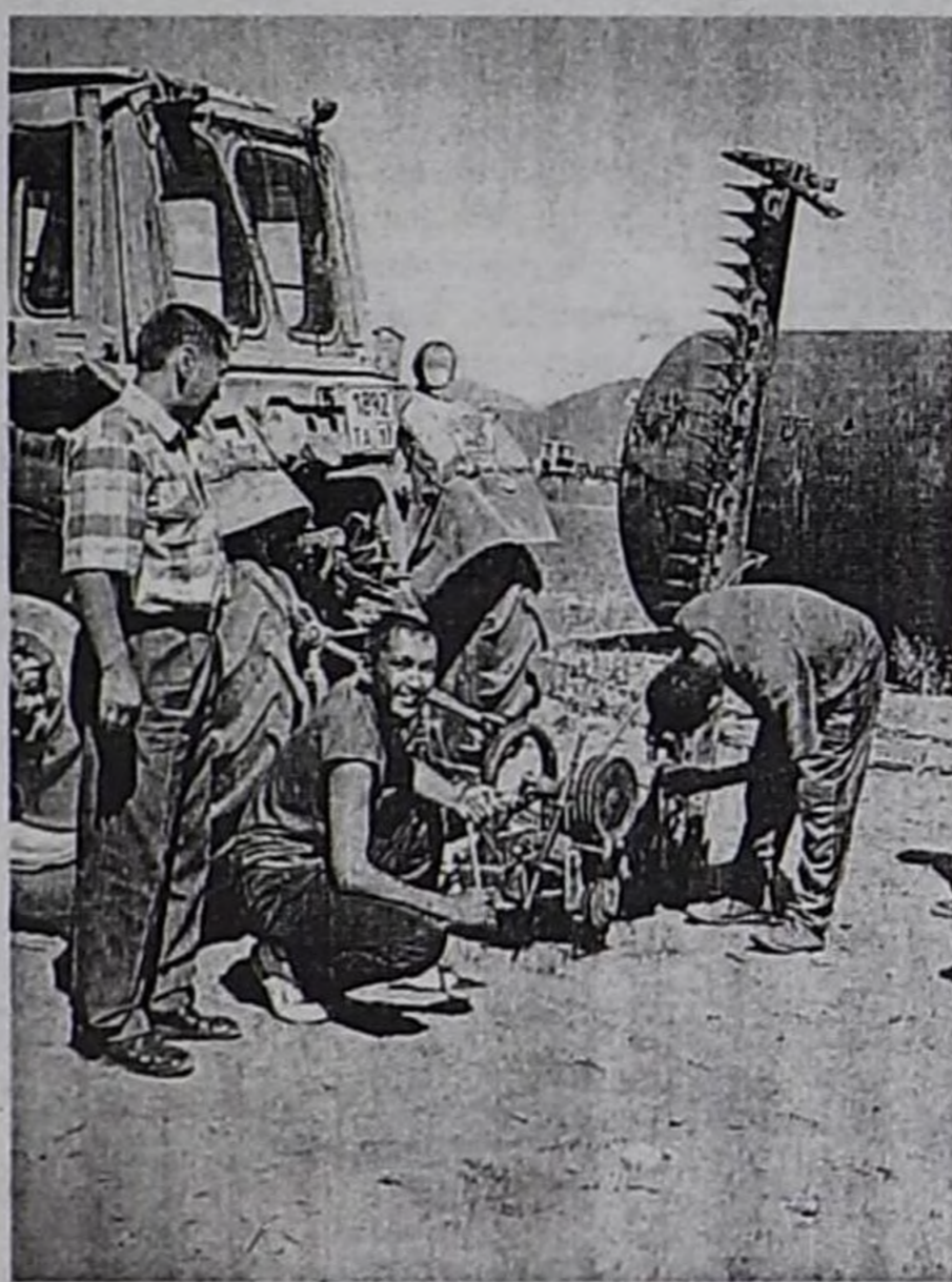
“Уланбура” трактористери сиген кезилдезинге белеткенип турлар.