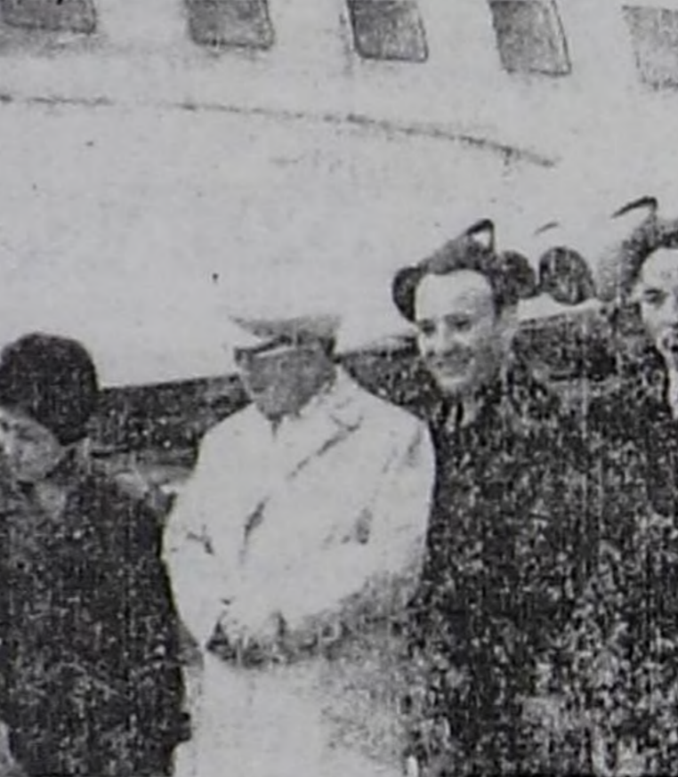
СЭКП Тыва обкомунуң бирги секретары С.К.Токаның (ортузунда) ВЛКСМ-ниң XV съездизинче Тываның комсомол организацианың делегаттарын Кызылдың аэропортундан үдеп турары. Чуруктуң солагай талазында ВЛКСМ Тыва обкомунуң бирги секретары Г.Ч.Ширшин.

Суг-Бажы суурга келиривиске, "Совет Тыва" колхозтуң комсомол организацианың багай ажилының дугайында хей хомудалдар көдүрүлгөн. Культура-массалыг, спорт ажилдары барык өшкөн. Суурда хей-ниити корум-чуруму баксыраан. Комсомолчулар идепкей чок, кежигүн дадывырын хей нуруузу төлевейн турар. Кежээки школага өөренип турган аныяктар өөрөдигезин ара каапкан суг-суг дээш, четпестер-ле хей. Актив-биле сүмелешип чугаалашкаш, бир неделя болгаш комсомолчу аныяктарның ниити хуралын