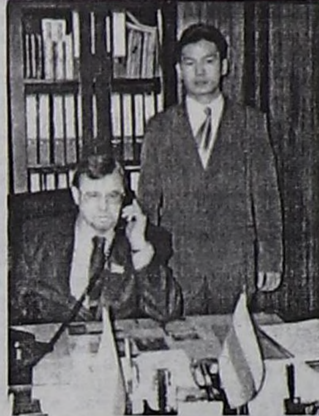
милицияның уруглар өрээлинге болгаш педагогика кафедрасын оларның кижизидилгезинче угланган ажилдарны чорудуп турганар.