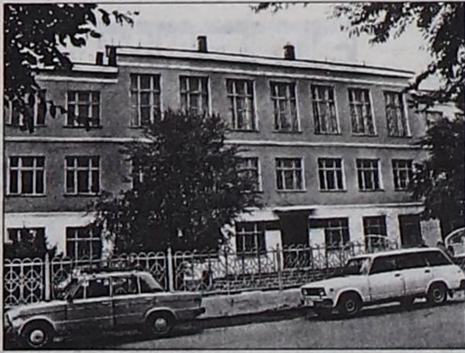
Тываның күрүне университетинин кол корпусу.