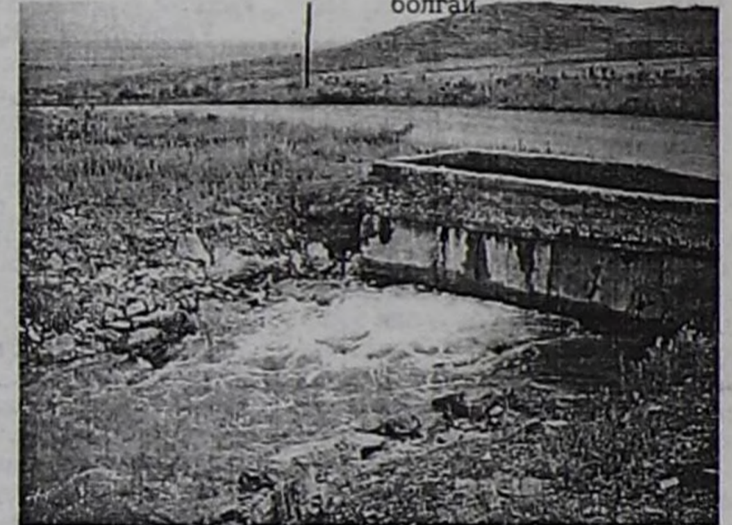
Шуйнуң суггарылга системазы бо хүннерде безин ажилдавышаан.

чоруп турары илерээн. Херек кырында суггарылга база сагыр негелдерлиг, чурумнарлыг-ла болгай.