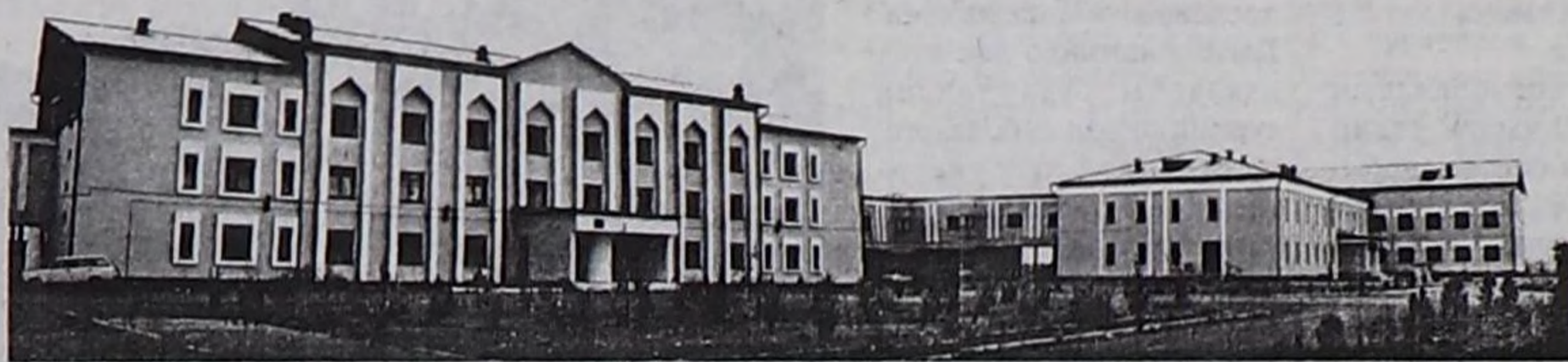
Эрткен чылын ажылгала кырген "Студентилер хоорайында" көдээ ажыл-агый болгаш күш-культура факультеттери.