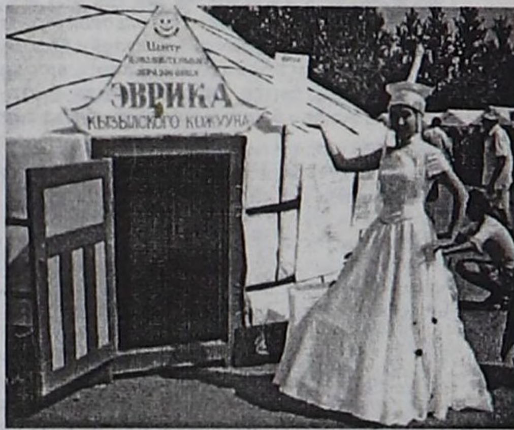
Кызыл кожунунун өөнүн чаңында тыва куда платьезинин көрүлдези.