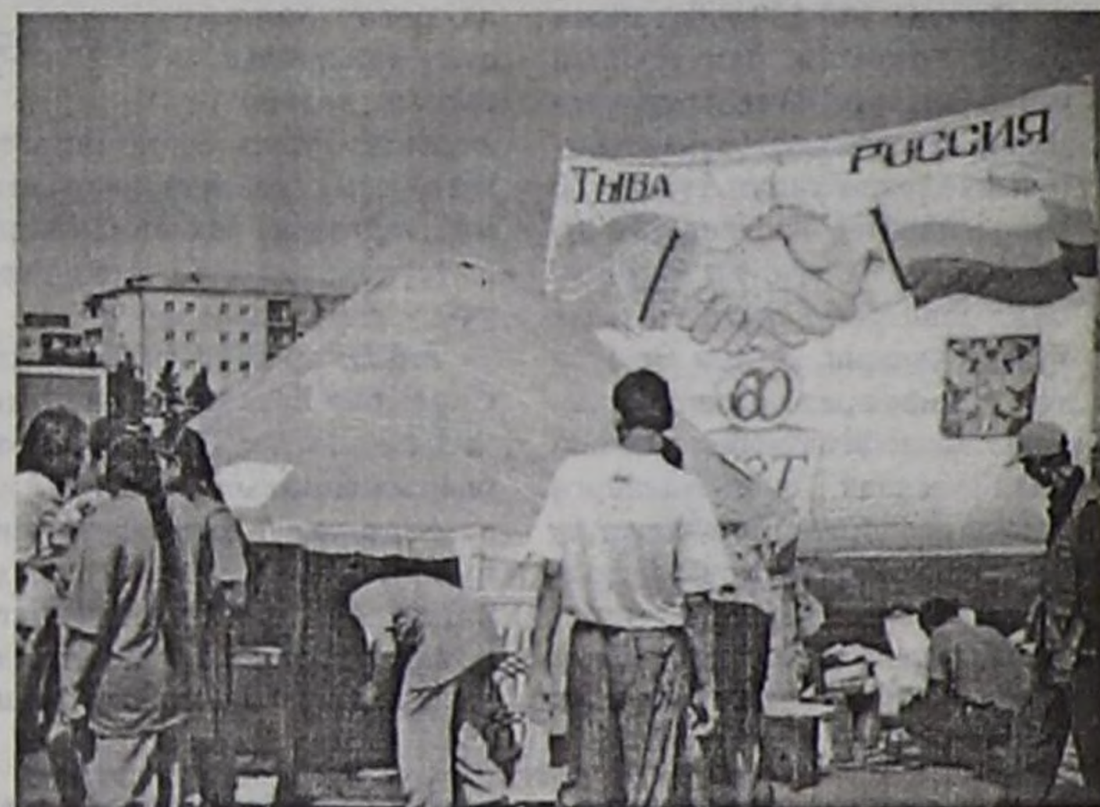
Барыш-Хемчик биле Улуг-Хем кожууннарының "Сайзанаак" өгжүтежи.

Конгресстиң киржикчилеринге Тыва Республиканың Чазак Даргазы Шериг-оол