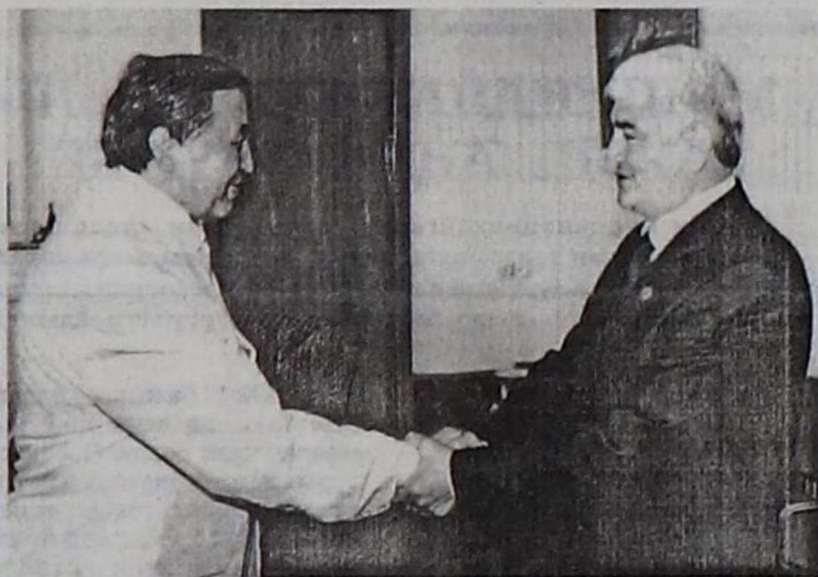
Тыва Республиканың Чазак Даргазы Ш.Д.Ооржак Таджикистанның камгалал сайыды генерал-полковник Шерали Харулаев-биле дүүн, июль 19-та, ужурашкан.

Шерали Хайруллаевич Харулаев 1971 чылда Тывага чедип келгеш, иштиги шериг кезинге албан эрттирип, беш чыл ажилдаан. Тыва чурттуг орус уруг-биле өг-бүлө туткан, бир оолдуг. Кадайы-биле кады Тывада дыштанып чедип келген.