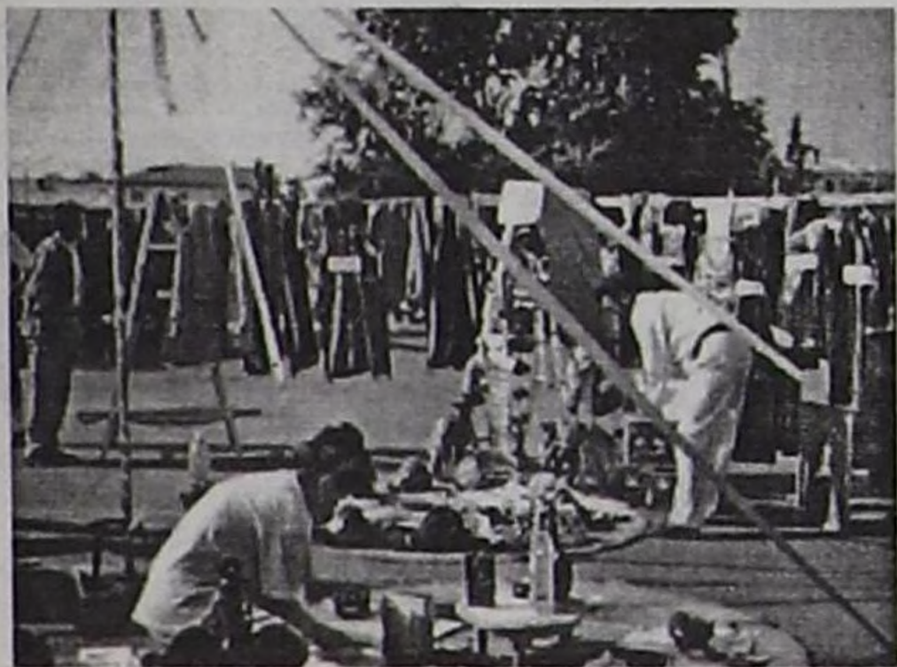
Алтай национал хеп болгаш өгнүң иштики хевири.