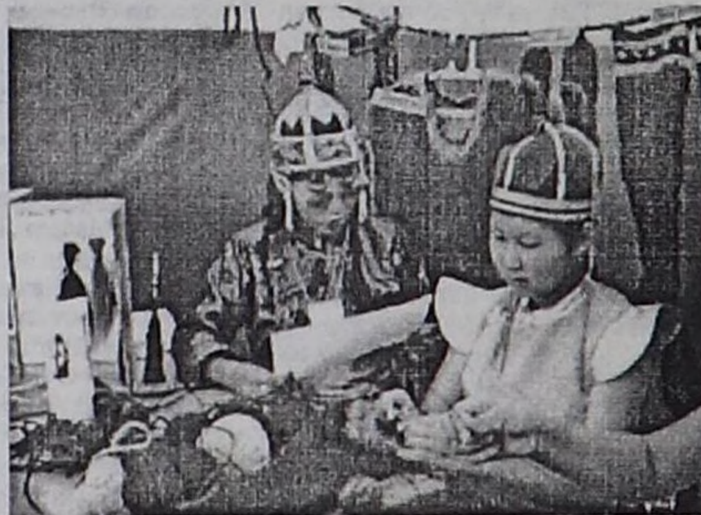
Кызылдын 9 дугаар школазынын өөреникчилери дүк-биле ажылдап турлар.