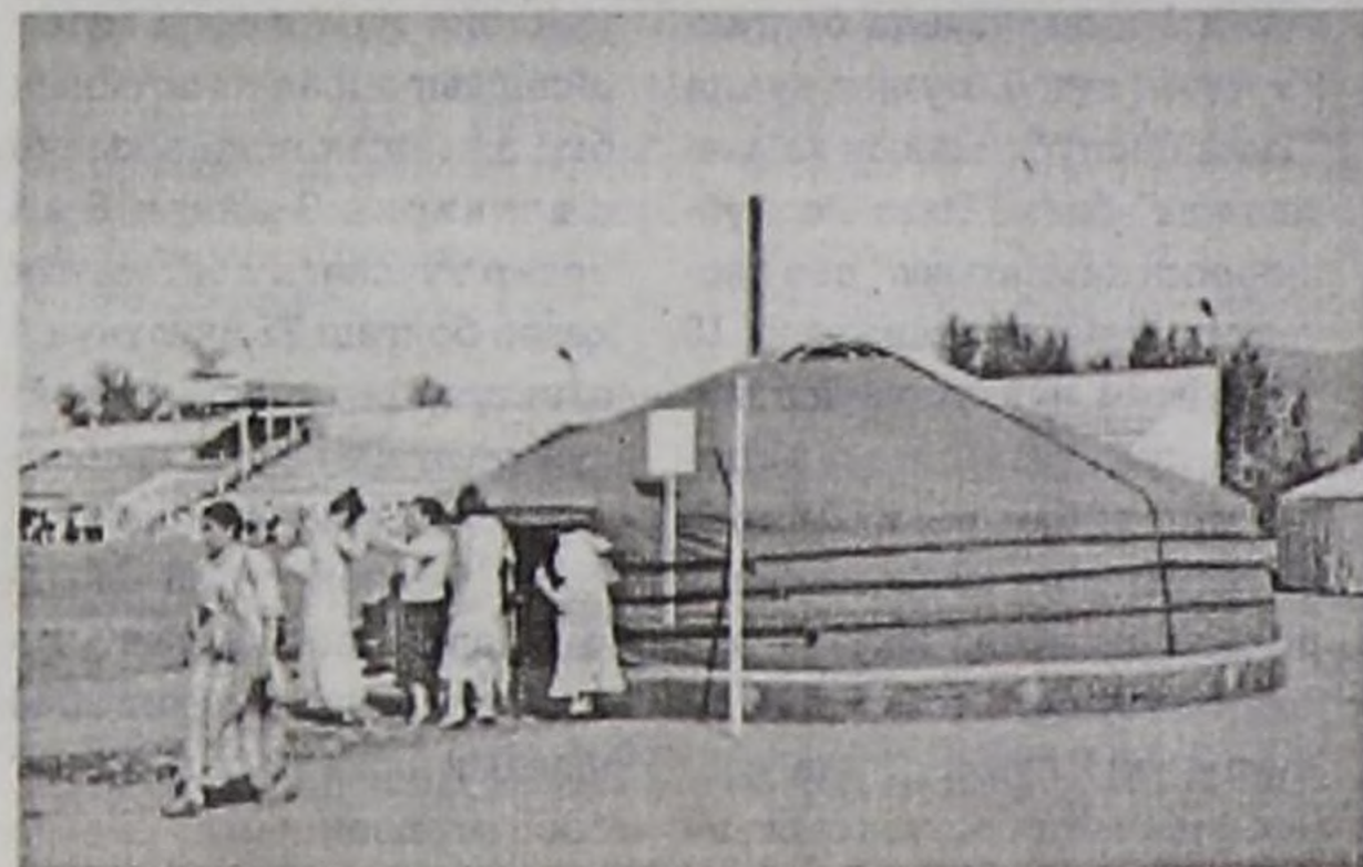
Тес-Хемниң "Чемзигбей" деп өөден аалчылар үзүлбээн.