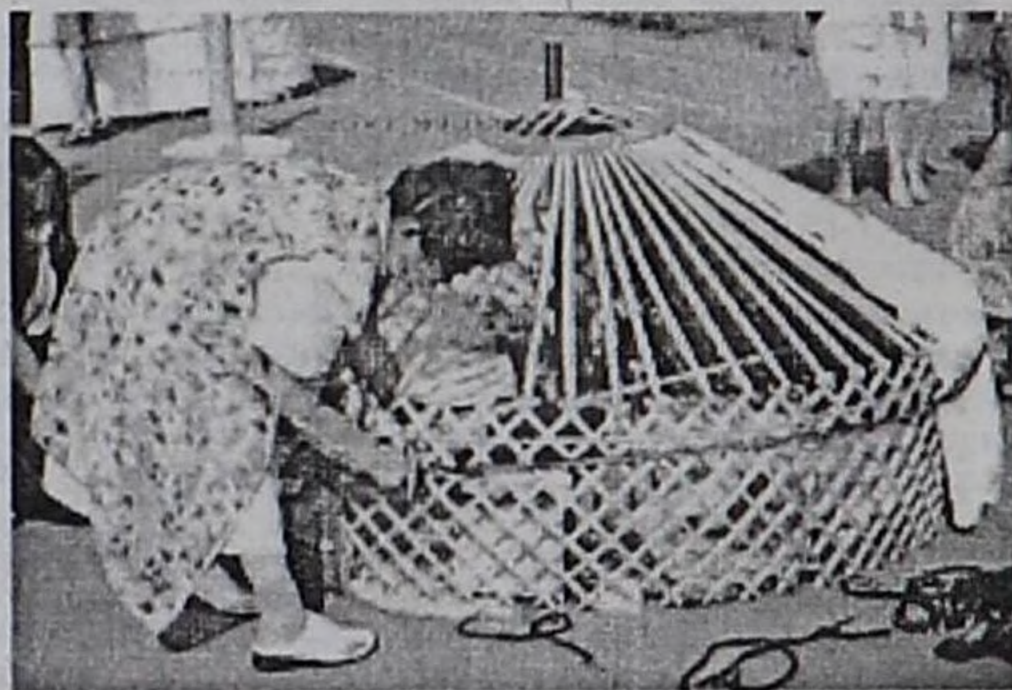
Кызыл-Мажалыктын А.Хомушку аттыг школазынын өгжүтежи.