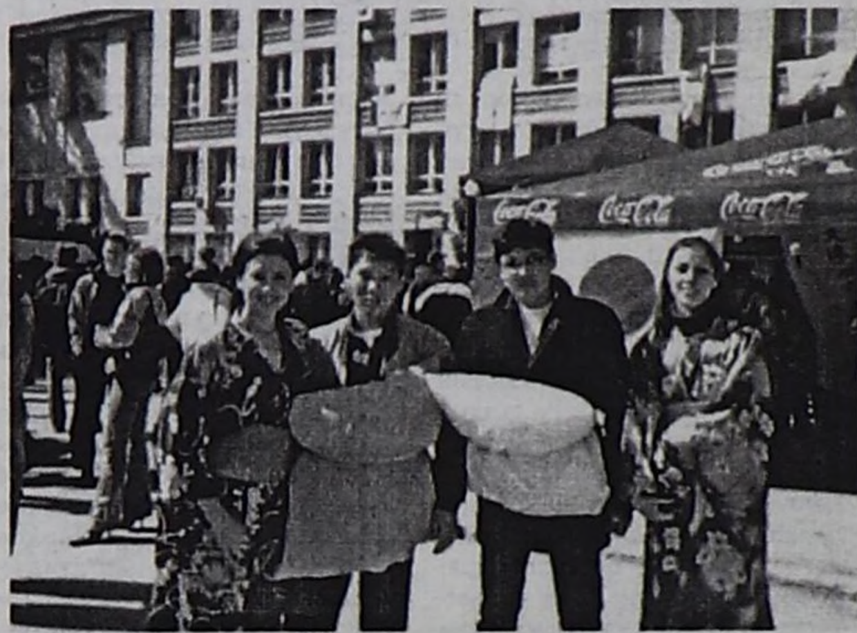
Новосибирск студенттериниң «Найырал» бөлүгү өңүктөрү-биле.

Кара-Сал Очур, НОВОСИБИРСК, НКУ, ол хоорайда тыва