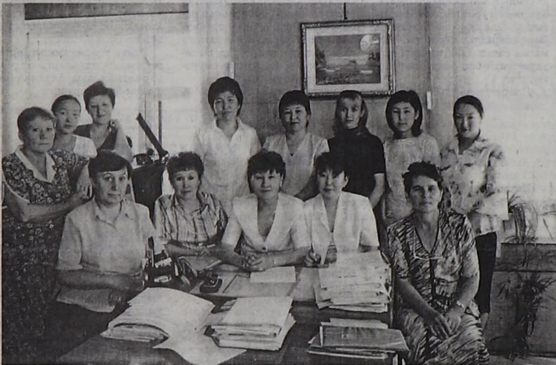
Кол күш — аныяктарда.