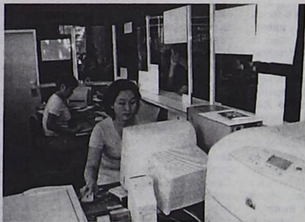
Интернет-кафелер ажыттынып, аныктарны өөредип турар.