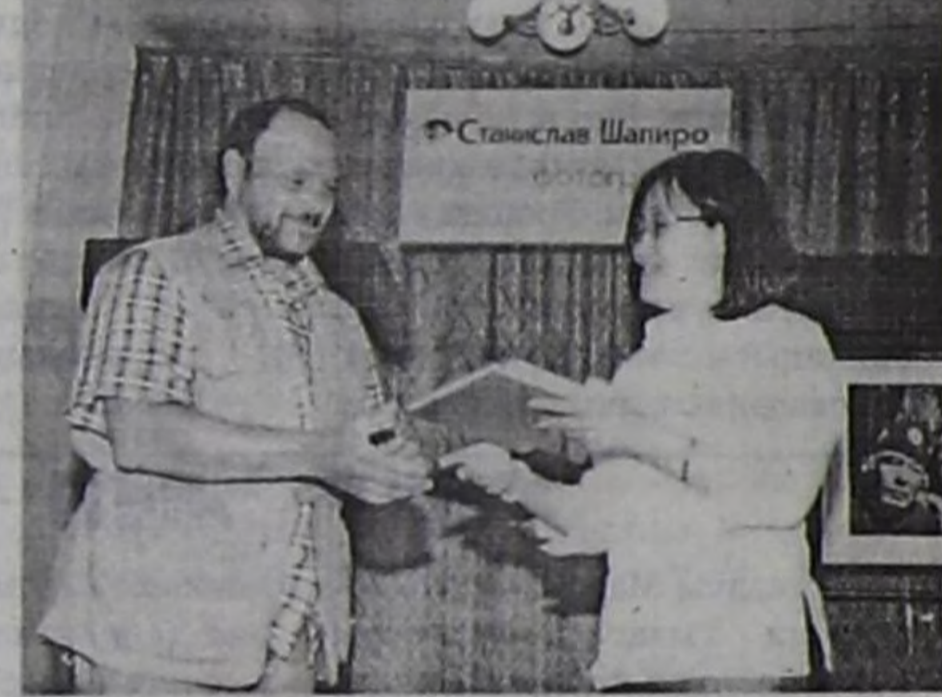
Культура яамызы фотографка ном белектерин берген.