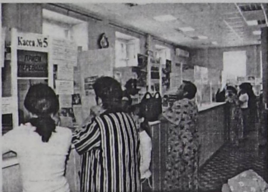
Акша-төгөрикти өй-шаанда шилчидип турар.