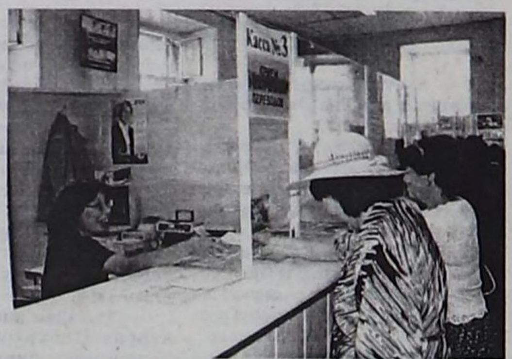
Пенсия акшазын саадатпай, айыткан хүнүнде үлөп турар.