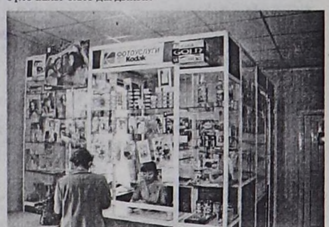
Хей орудгалы — «Кодак» фирмандан