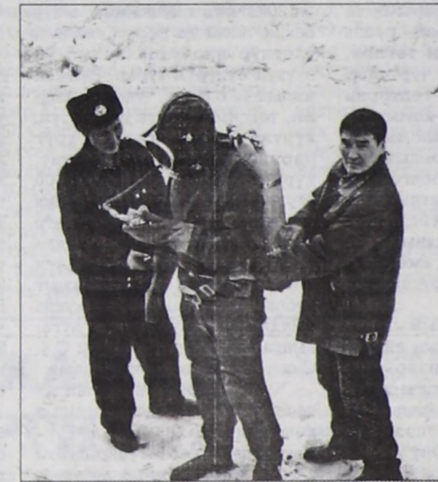
Биче хемелерниң күрүне инспекциязының камгалал албанының ажилдакчылары өөредилге үезинде.

Хамааты камгалал болгаш онза байдалдар яамызы инспекцияның ажилын чаа деңнелче көдүрер, оон материал-техниктиг баазанын быжыглаар болгаш кадрлар белеткелин экижидер дээрзинге бүзүрээр мен.