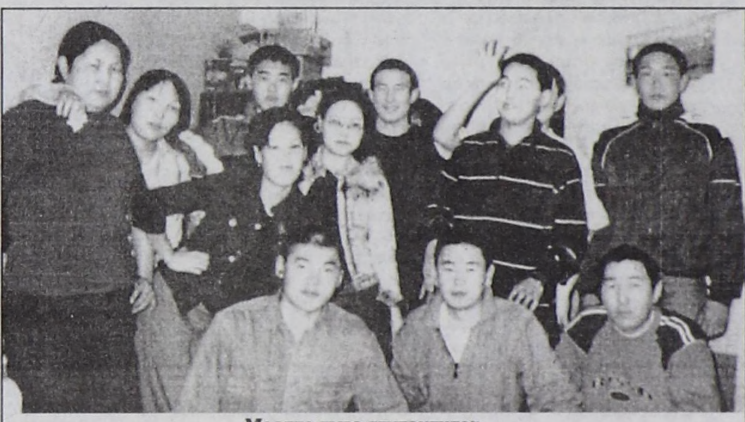
Моолда тыва студентилер.

чаалап ап болурунун барымдаазы база көстүп кээр боор.