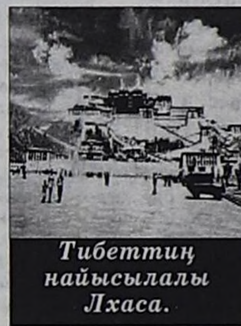
Тибеттиң найысылалы Лхаса.

1987 чылда Далай-Лама «Беш кезектен тургустунган планны» идип үндүргөн, ында ол кедизинде барып Тибетке тайбың девискээрин тургузарын саналдап турар. Ол документиде кыдаттарны Тибетче массалыг көжүүшкүнүн соксадырын, ук чуртка кижиниң кол-кол эргелерин болгаш демократияның хосталгаларын катап тургузарын, Тибеттиң девискээрин ядролуг артынчылар хөмөр девискээр кылдыр ажыглаарын соксадырын, тибет айтырыг талазы-биле тайбың чугаалажылгаларны эгелээрин база Тибеттиң болгаш Кыдаттың чоннарының аразында амыр-тайбың кожухелбээ харылзааларны тургузарын саналдап турар.