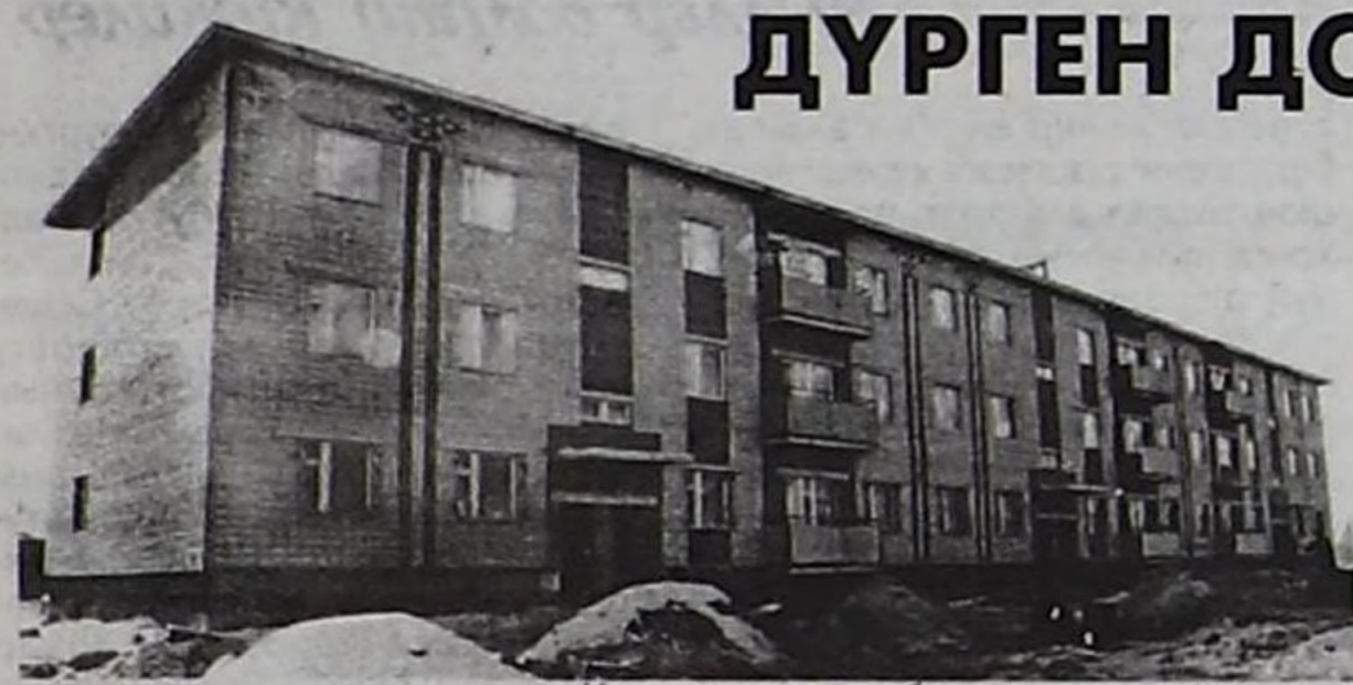
Чаа чуртталга бажыңы.

• Бо бажыңның тудуу декабрь 31-ге чедир доозулган турар уjurлуг •