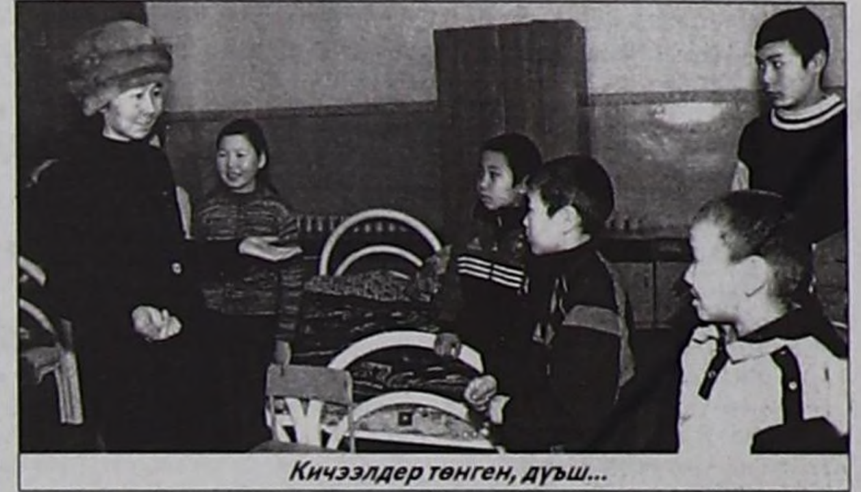
Кичээлдер төнгөн, дүш...

Шупту ажилдарын хол-биле кылып пекарня байырлалдар таварыштыр чурттакчы чоннуң чагыын езугаар төгерик хлебтерни, булочкалары, торттары база быжыргылаар. Садыгының орулгазы хлеб-биле катый хүнде 1600-1800 рубль чедер бээр. Ажилчынарның акша-шалыңы айда 1200 рубльден ашпаза-даа, үе-шаанда үнүп турар, оозу эки.