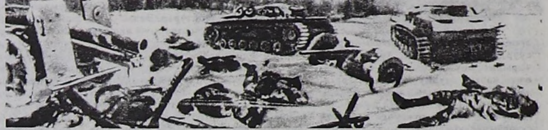
Москва чоогунга немец шериглерни чылча шапкан соонда (1941 чыл, декабрь).

дайын артык күштүг болганындан Москва облазының девискээринче кирип, найысылалче чоокшулап орган. Москваны дайынга бүзээлеттирген хоорай деп ССРЭ-ниң Оран камгалалының комитеди октябрь 20-де чарлаан. Чазактың болгаш партияның чамдык төп албан черлерин Куйбышевче көжүргөн.