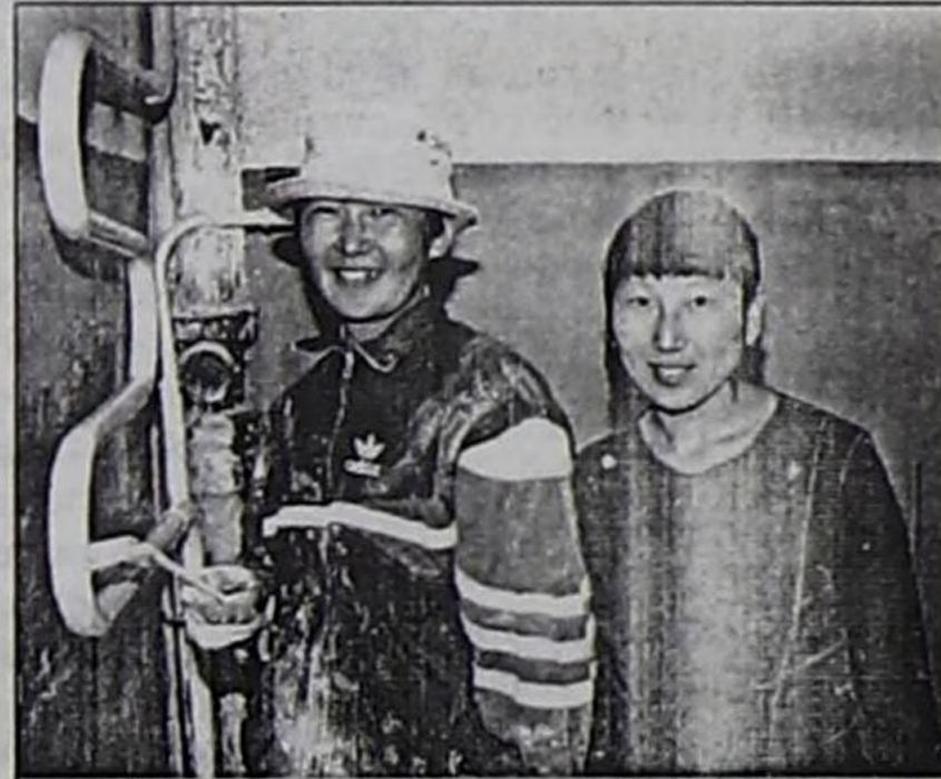
Маляр кыстар Уран биле Хажытмаа ажыл үезинде.

тургуспайн турар. Көрдүнген акша өй-шаанда кээп, тудуг материалдары-биле хандырылга эки болур болза, бо тудуг бир ай четпес доосту бээрин кол инженер чугаалап турду.