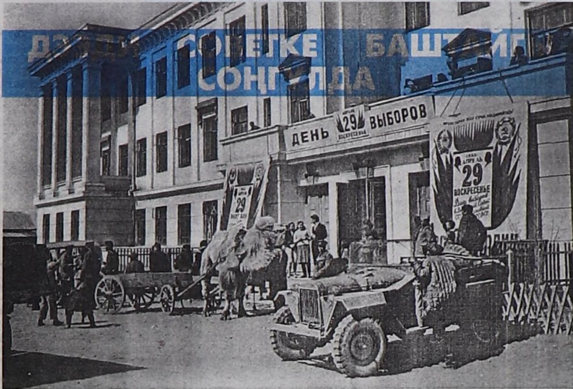
Фото-чуруктарда — Тываның төөгүзү

Совет Эвилелиниң составына Тываның 1944 чылдың октябрь 11-де эки тура-биле каттышканы — тыва улустун төөгүзүне политиктиги, социал-экономиктиги хөгжүлдүниң күчүлүг көдүрлүүшкүнүнүн эгезин салган. Тыва араттар совет күрүнениң эрге-чагыргазының дээди органнарынга боттарының төлээлекчилерин (депутаттарын) соңгуур бүрүн эргелиг болган.