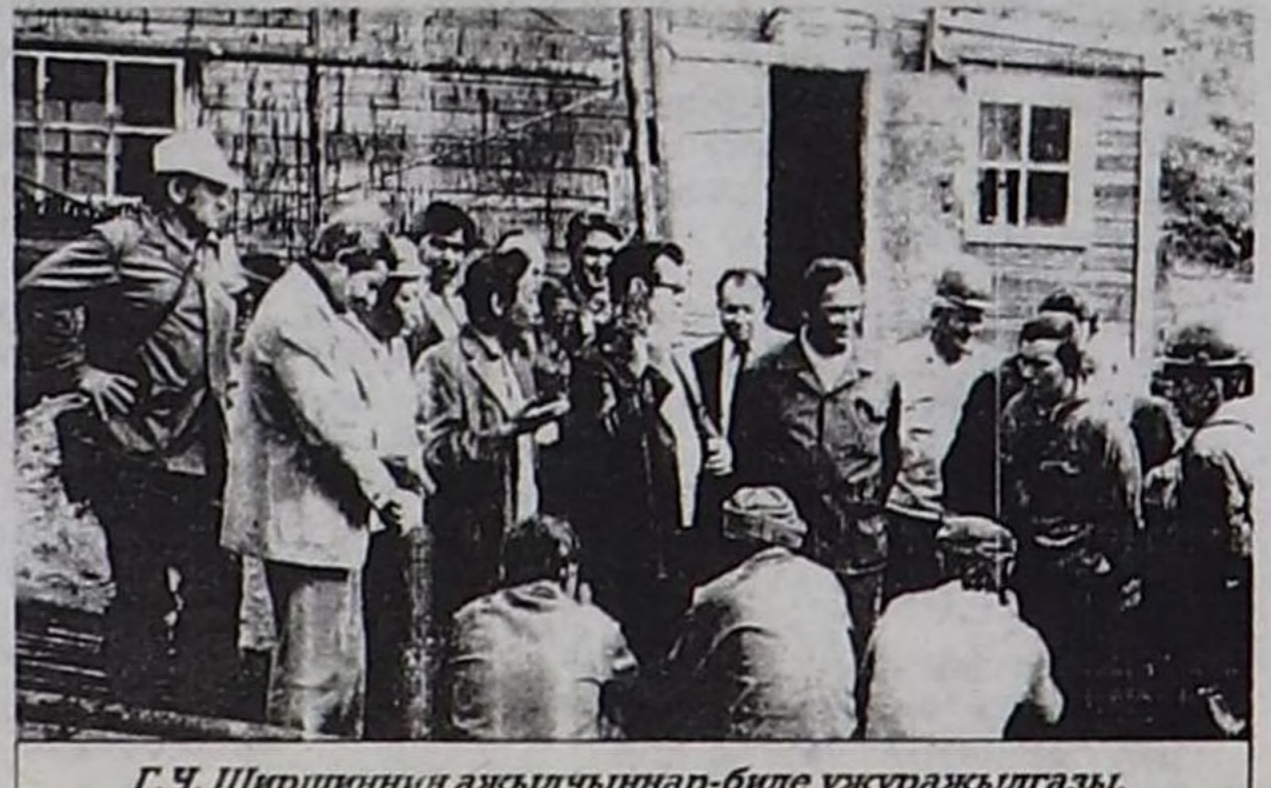
Г. Ч. Ширшиниң ажилчылар-биле ужуражылганы.