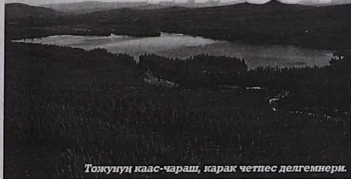
Тожунуң каас-чараш, карак четпес делгемнери.

Азия төвүндө чыдар республиканың байлааның дугайында тайылбырлыг чарлалдар чүгле бойдуска ынак аңчыларны болгаш балыкчы-спортчуларны бодунче хаара тудуп турар эвес, бойдус курлавырларын төтчеглекчи езу-биле ажыглап өөрөнгө чазый кожоларывыстың чилбизин хайындырыпкан. Тываның бойдус курлавырларын камгалаарын харыылаар ведомство чөптүг чылдагааннарның уржуундан ону чогуур деңгелинге чедир хайгаарап шыдавайн турар. Республиканың девискээри дыка улуг, аңчыларның болгаш балыкчыларның күрүне инспекторларының штады бичии, ооң-биле күштүг техника, кывар-чаар материалдарның лимиди, тускай көрдүнгөн чеп-