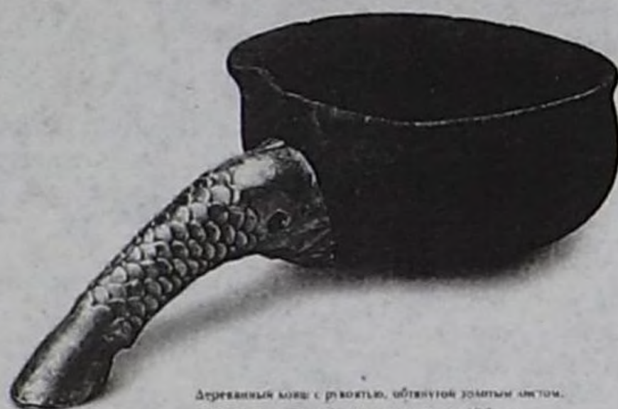
Аржаан-2 базырыктан тывылган металл чашка, илчир-белиг. Диаметр по верху 11 см, диаметр по низу 10,3 см.

Хаанның-даа, кадының-даа мөчү-сөөктери бөрттеринден эгелээш, идиктериниң эжектеринге чедир алдын каасталга кылыгылар-биле дериттиш шиметтинген. Дээди чагырыкчының чүгле чүвүрүн безин 1 мм хемчээлдиг 100 муң ажыг алдын суг чинчилер-биле каастап даараан! Хейлеңинге араатан димс амытан дүрзүлүг 2 муң базыткылыгы чыпшыр илген! Оларның чаңгызының хемчээли 2,5 сантиметр . Согун-