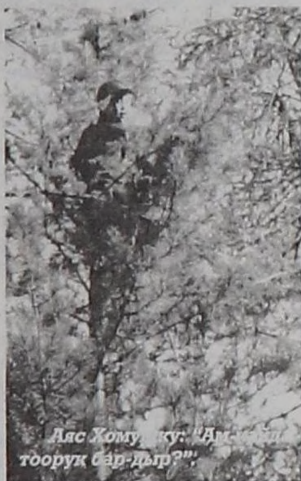
Аяс Хому, кы: “Ажыл-тоорук бар-дыр?”

Тыва кат-чимис, тооруктуг тайгалар-биле байлак. Өвүрнүң Саглы сумузунуң девискээринде Ортаа-Халыын, Кыдыы-Халыын, Үш-Хая, Кызыл-Чыраа, Хорумнуг-Ой тайгаларынга бо чылын инекараа, көк-кат, казылган, кишкулаа, тоорук база мөөгү элбээ-биле үнген.