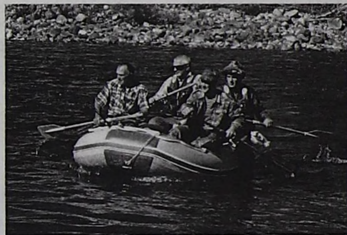
Хакасиядан келген бөлүк балыкчылар.

Тыва АССР-ниң профэвилели чурттакчы чонун, албан-хаакчыларның болгаш школачыларның дыштанылганын, кадыын быжыглаарына "Чедер", "Үш-Белдир" курорттарының материал-техниктиг баазанын экижидер дээш хөй ажылдарны кылган. Ооң түннелинде чонун дыштанып эмнедиринге таарымчалыг байдалдар тургустунган. Чээрби дөрт хонуктуг сезон санында-ла 350 кижиден эвээш дыштаныкчылар дыштанып турду. Ынча хөй кижини чаңгыс аяк хүнде самолет-биле "Үш-Белдир" курортунга чедиргеш, чурттаар оран-сава, аш-чем-биле бүрүн хандырып турганын ынчангы дыштаныкчылар ам-даа утпааннар.