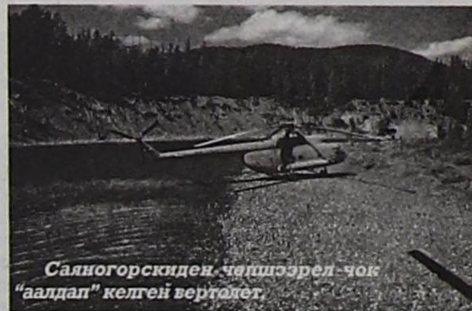
Саяногорскиден чөпшээрел чок "аалдап" келген вертолет.

ралдың ниити түнү 45 муң хире рубль болган. Ооң-биле чергелештир чурум хажыдыкчыларының кижини бүрүзүңгө 1 муң рубльдин торгаалын онаанган. Боо эелерин база торгаан. Вертолеттун эзелеринге болгаш экипажтың кежигүннеринге хамаарыштыр тускай чугаа болур.