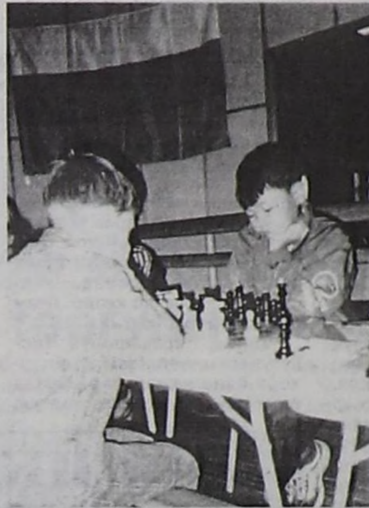
нерге база киржикчилерге

Фестивальга 2 оол, 1 уругдан тургустунган командалар аразына маргылдаага бирги черни новосибиржилерниң шыырак дээн белеткелдиг «Гамбит» командасы ээлээн. Шаңналдыг черлерни ээлээн-