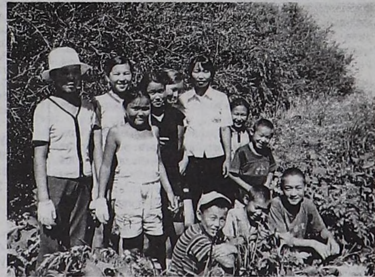
Теве-Хая ортумаа школазының өөреникчилери ногаалар ажаалдазында.