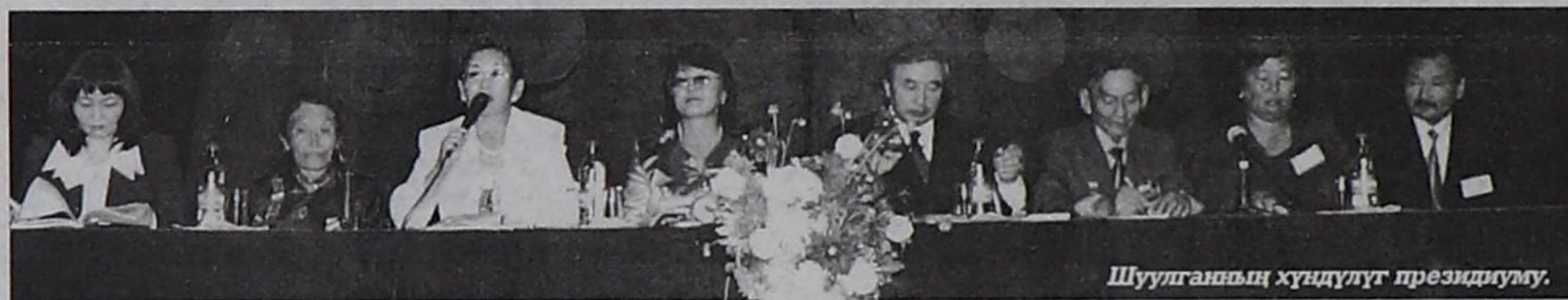
Шуулганның хүндүлүг президиуму.

Август 11-де С.Пюрбю аттыг Улусчу чогаалдыг бажыңыга Төп Азия девискээринин чурттарында болгаш Россия Федерациязының субъектилеринде чурттап турар үндезин тываларның бирги шуулганы болуп эрткен. Моолдун Улан-Батордан база чоок-кавы аймактарындан, Бурятиядан, Красноярск крайдан төлээлер келген. Ниитизи-биле 263 кижиге ук шуулганга киришкен.