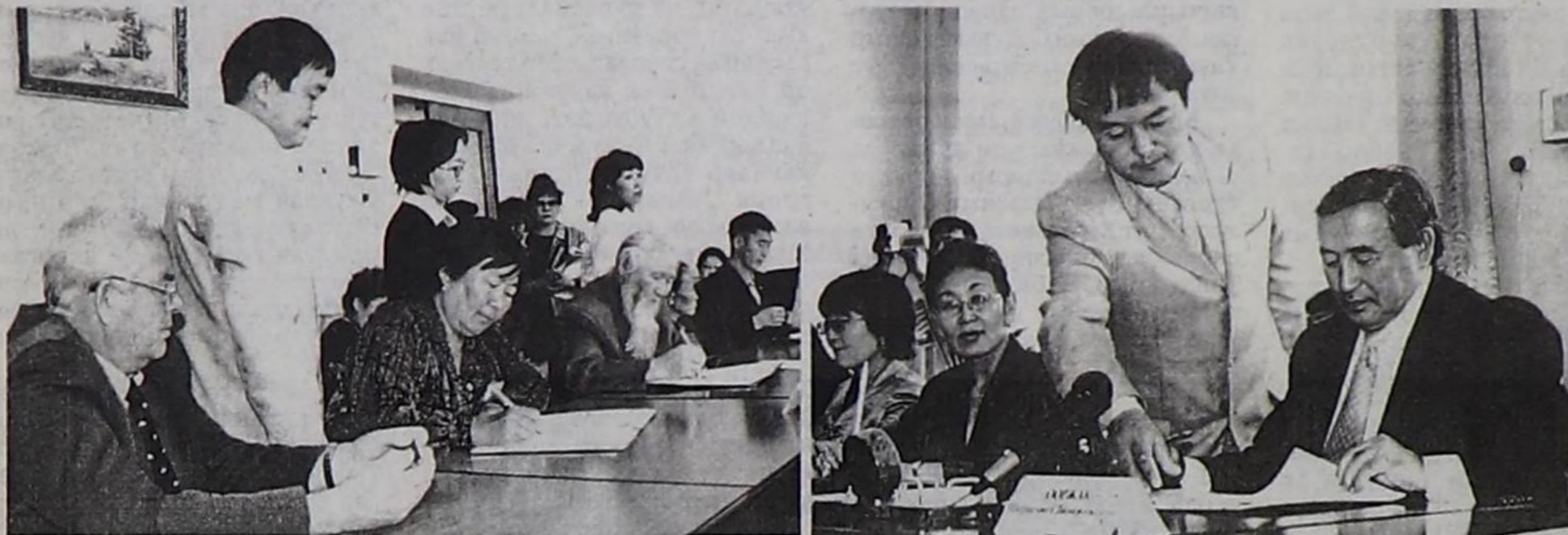
Чугула документиге ат салып турары.

Август 13-те ТР-ниң Чазак Бажыныңга Төп Азия девискээринин чурттарында болгаш Россия Федерациязының субъектилеринде чурттап чоруур үндезин тываларның бирги шуулганының резолюциязынга ат салырының байырлыг хуралы болган. Аңаа Тываның, Моолдун, Бурятияның, Красноярск крайның шуулганга киржи келген делегациялары, оларның удуртукчулары болгаш ТР-ниң Чазаның