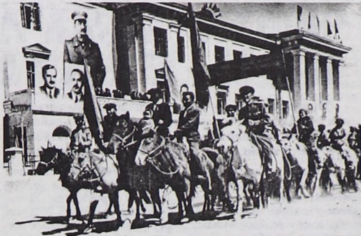
ССРЭ-ге каттышканының 1 чылдаанын 1955 чылда байырлап турганы.