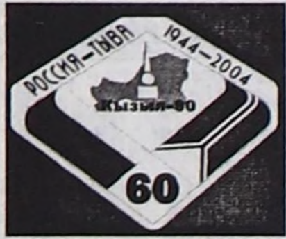
(Тончүзү. Эгези № 66 "Шында" арында).

Ол бүгү чедишкннер бедик культуралыг, сайзыраңгай Россия (ССРЭ)-биле кады ажилдажылганын түннели, чаңгыс күрүне тургузуу бооп чурттап чоруурувус ачызы деп чүвени тыва кижжи бүрүзү билдир.