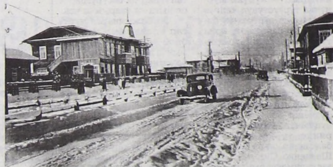
Кызыл хоорайның Ленин кудумчусу 1940 чылдар үезинде.

1944 чылда Тыва Арат Республика ССРЭ-ниң составына эки тура-биле каттыжып кирип турда, 57 чүк сөөртүр автомобиль, 2 автобус, 3 пассажирлер аргыштырарына ажыглаар чүк машиналары, 20 хире чик машиналар турган. Дайын муруну чарында ТАР-га машиналар моон хөй турган, оларның чамдызын фронттуге алгаш