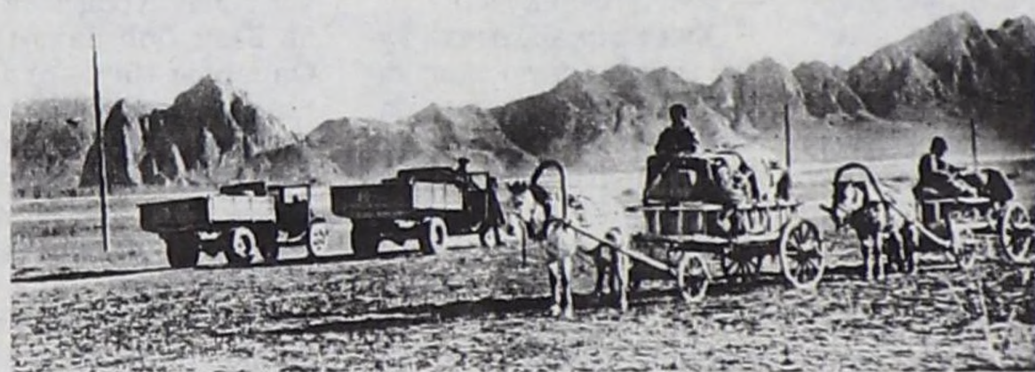
Тыва 1930 чылдар үезинде.

ажык дээр адаанга турар. Артык кезектер чедишпес, рессорлары, болтулары болгаш өске-даа бөдүүн кезектерни мастерскаяга кылып ап турганнар. Ол үеде Кызылга чолаачылар өөредир автошкола турбаан, ССРЭ-ден ажылдап келген баштайгы орус чолаачылар, чалаттырып келген инженерлер тыва кадрлары автомобиль транспортуң башкаар талазы-биле өөредип, тодаргай хемчеглерни ап чоруканының түннелинде, 1932 чылдан эгелеп баштайгы тыва оолдар автомобильди башкарып эгелей берген. Республиканың кончуг берге оруктарына ажыл-