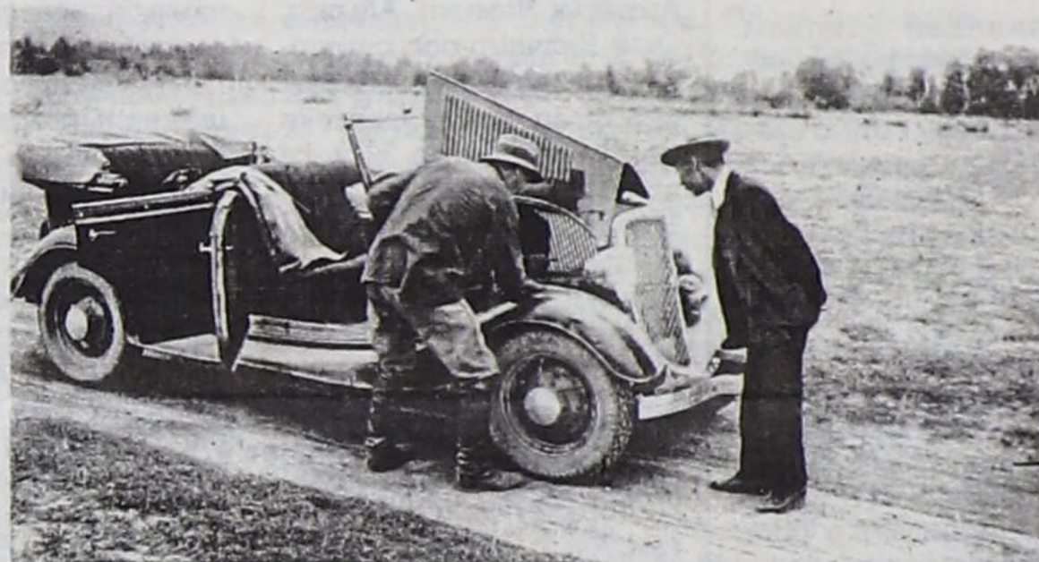
Тывага бир дугаар келген машина «Додж».

1935 чылда Тывага бир дугаар ЗИС-8 болгаш ГАЗ-АА ийи автобус келген. Ада-чурттуң Улуг