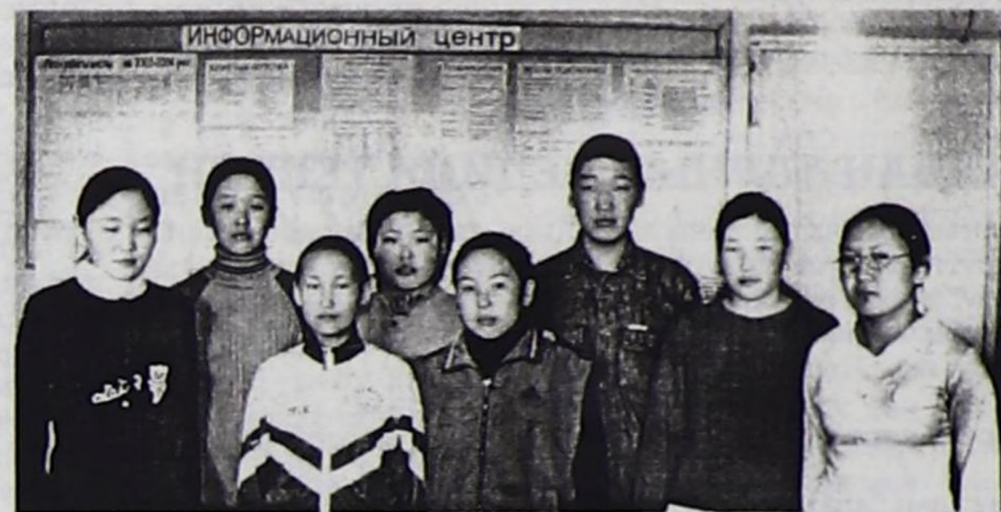
Школаның эң тергик өөреникчилери.