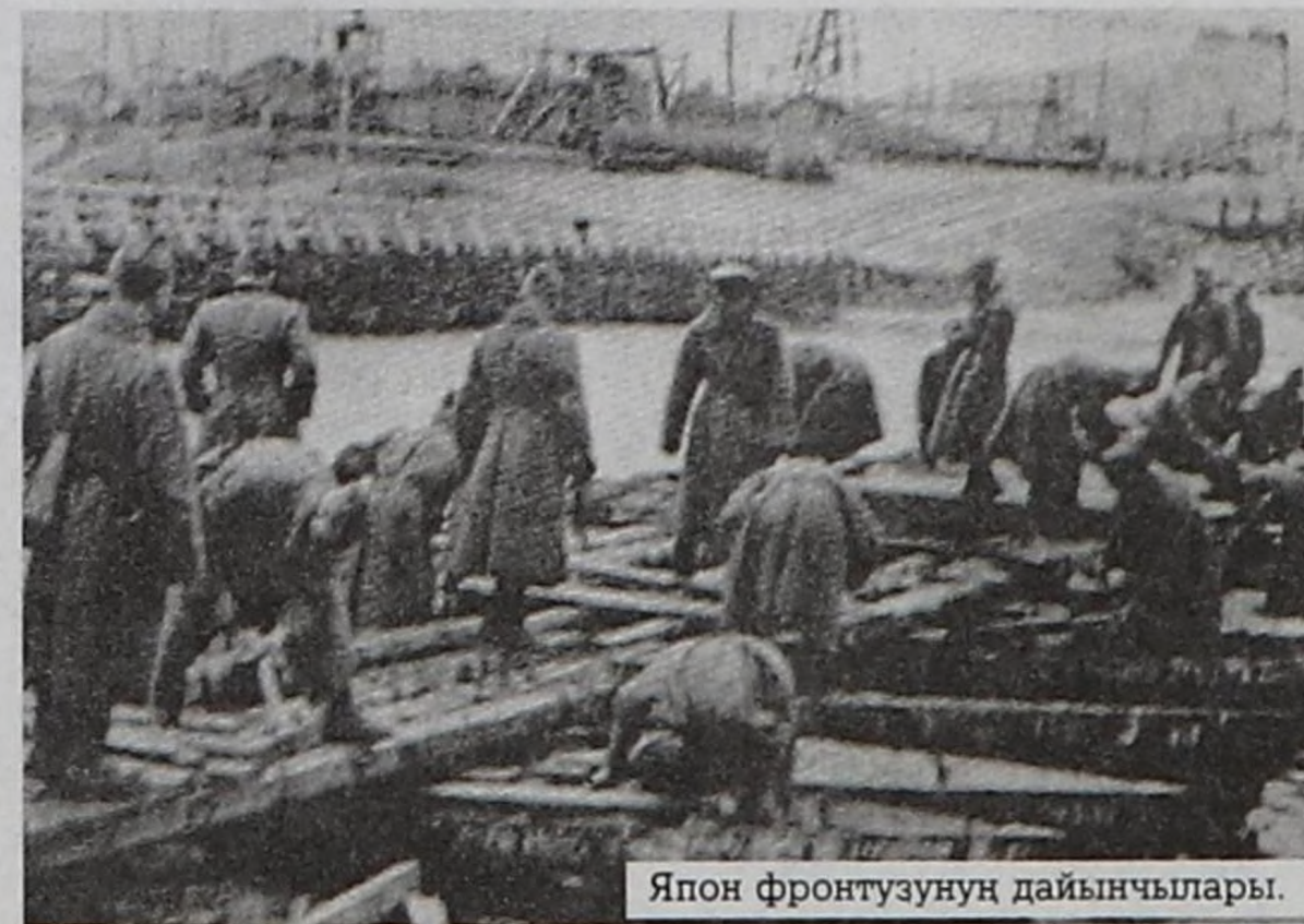
Япон фронтузунуң дайынчылары.

Сталинград тулчуушкуну ниитизи-биле 200 хүн үргүлчүлээш. Дайынның кадыг-дошкун хүнеринде сталинградчылар төрөөн хоорайын немец-фашистиг шериглерден камгалаар дээш Совет Армияның шериглери биле кады ополчен шеринге муң-муң сталинградчылар