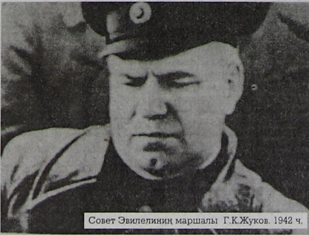
Совет Эвилелиниң маршалы Г.К.Жуков. 1942 ч.