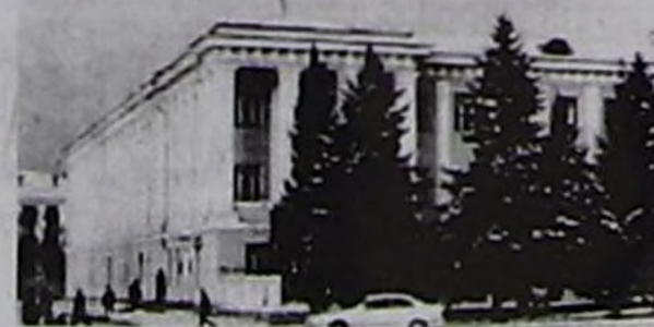
лынга оларның талазындан сагындырыг чок болган.

Январь 24-те Кызыл хоорайның хемниң оң талазында 2 каът чуртталга бажыңнарын болгаш школаларны суг-биле хандыраар чаа чер ажылгалга кирген. Төлөвилел езугаар 3 миллион 261 муң рубль өртектиг объектини "Улетпур чуртталга тудуг" хааглыг акционерлиг ниитилел (чингине директор Владимир Капустин) эрткен чылдың октябрь айда тудуп эгелээш, бо хүннерде дооскан. Хүнде 50 куб. метр суг мөөңнээр черни моон сонгаар "Водоканал" бүдүрүлгө чери эдилээр. Тудугжуларның ажы-