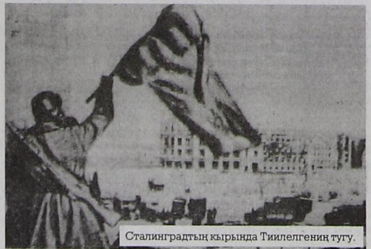
Сталинградтын кырында Тиилегениң тугу.

Сталинниң удуртулгазы-биле сталинград бүзээлелиниң планын кончуг чажыт байдалга ажылдап кылган. Эгезинде ону чүгле Сталин, Жуков, Василевский билер турган. Ол хамаанчок армия командылакчылары безин чүгле ноябрьның эгезинде фронтуларны каттыштыргаш, чаңгыс сталинград