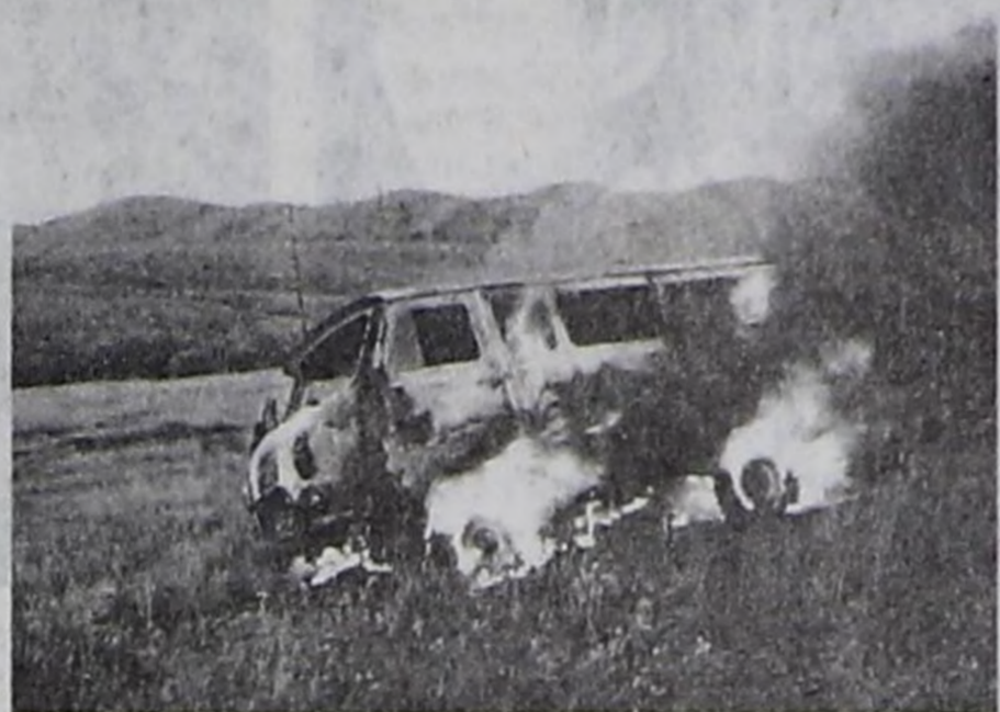
риниң дугайында шийтпири хулээп алганнар.

1970 орук демдээниң чүглө 800-ү бар. Акша-төгөриктиң чогу амгы үениң техниктиг дериглерин болгаш светофор объектилерин дерийринге, орук демдеглээринге материалдарны ажыглаар арганы бербейн турар. Эң берге байдал — республиканың кожуннарында. Тургустунуп келген байдалды болгаш оон ниити республика ужур-уткалыын өөренип көргөш, комиссия кежигүннери оруктарның техниктиг дерийшикини акшаландыраарының дугайында доктаалдын телевилелин ТР-ниң Чазак-га сайгарып көөрү-биле киире-