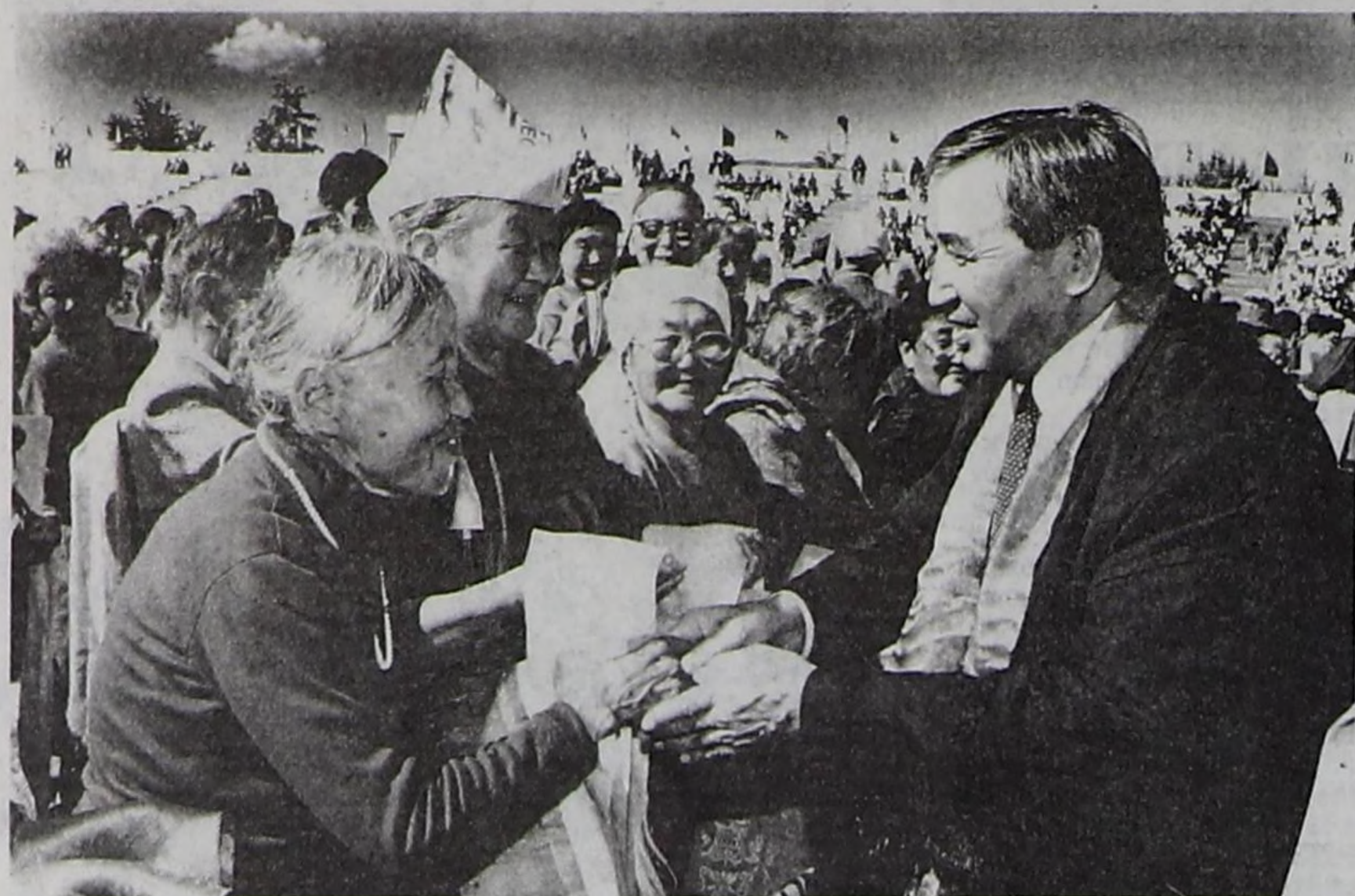
Чазак Даргазының ужуражылгалары