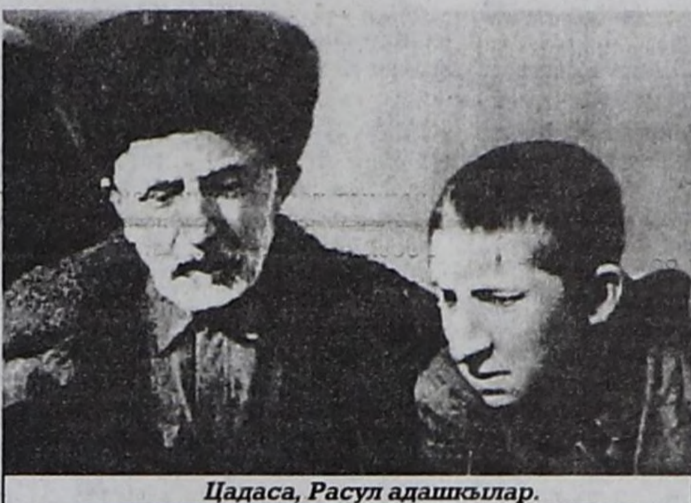
Цадаса, Расул адашкылар.

хыйланып чорааннар. А херек кырында шупту бергелерни олар дег шыдамык эртип шыдаар кижилер чок.