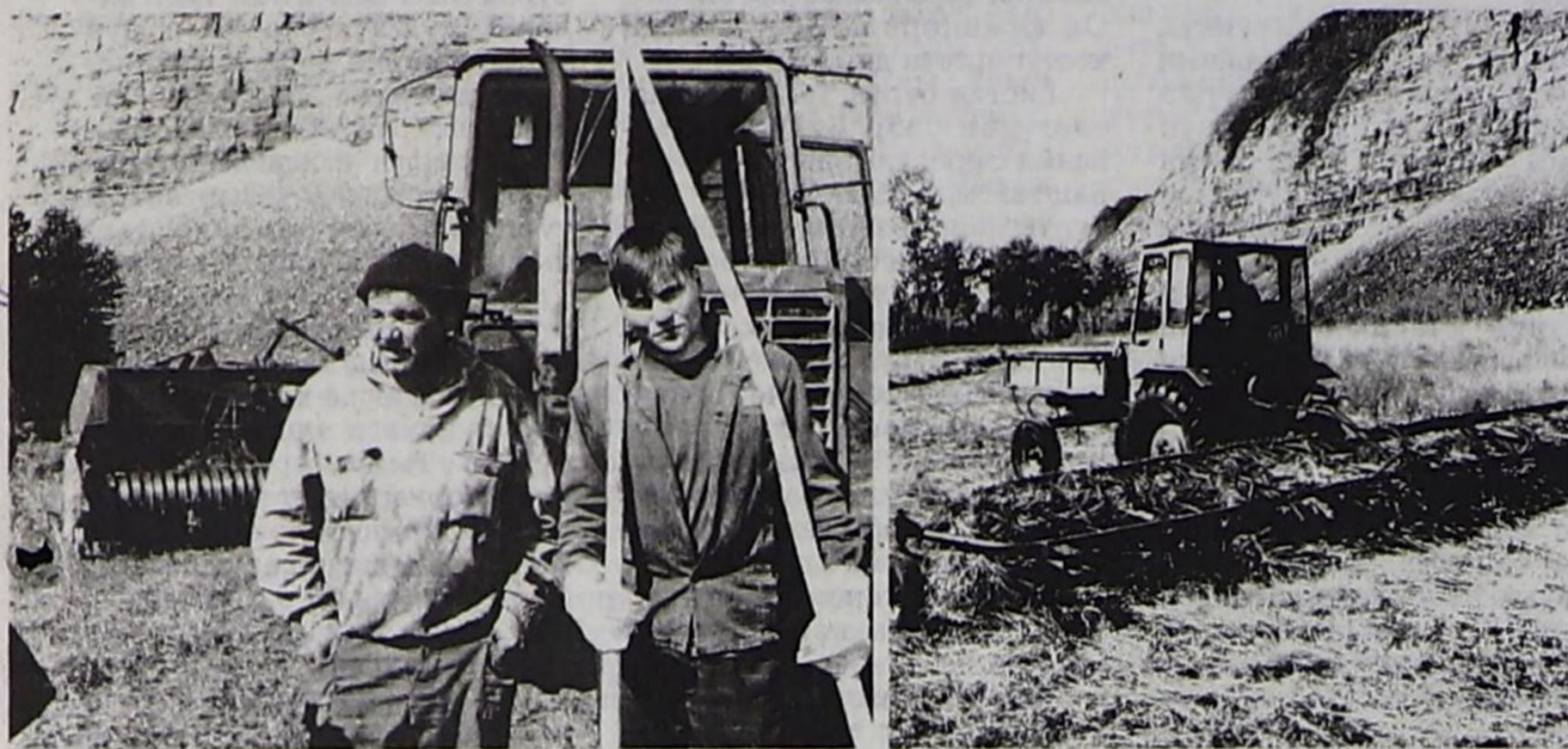
Республиканың сиген шөлдеринде

Ат салган шагы 18.00 Садар өртээ 4 рубль.