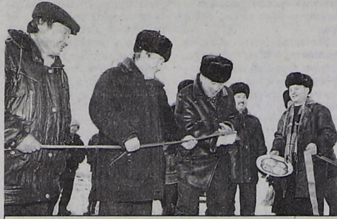
Байырлыг ажыдышкын үезинде.

Кызыл—Хову-Аксы аразында автооруктуң дорттап аргыжар 700 метр участогун «Восток» кызыгаарлаттынган харысалгалыг эштежилгениң (начальниги С.В. Юсов) ажылчынары кылып дооскан. «Восток» КХЭ — кончуг күштүг техникалыг, бедик мергежилди кадрларлыг, автоорук кылып талазы-биле республикада эң шыырак бүдүрүлгелерниң бирээзи. Бо чылын олар Чадаана—Суг-Аксы аразында автооруктуң эң берге