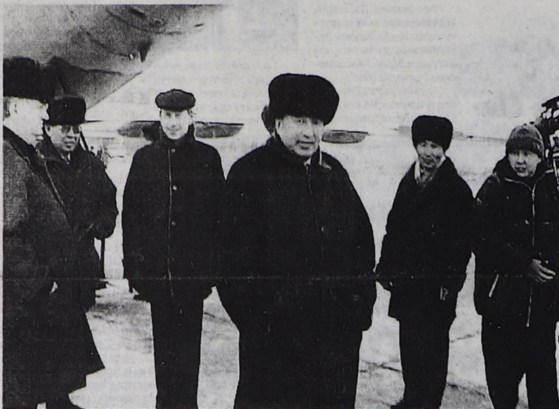
Аэропортка ужуражылга үезинде.