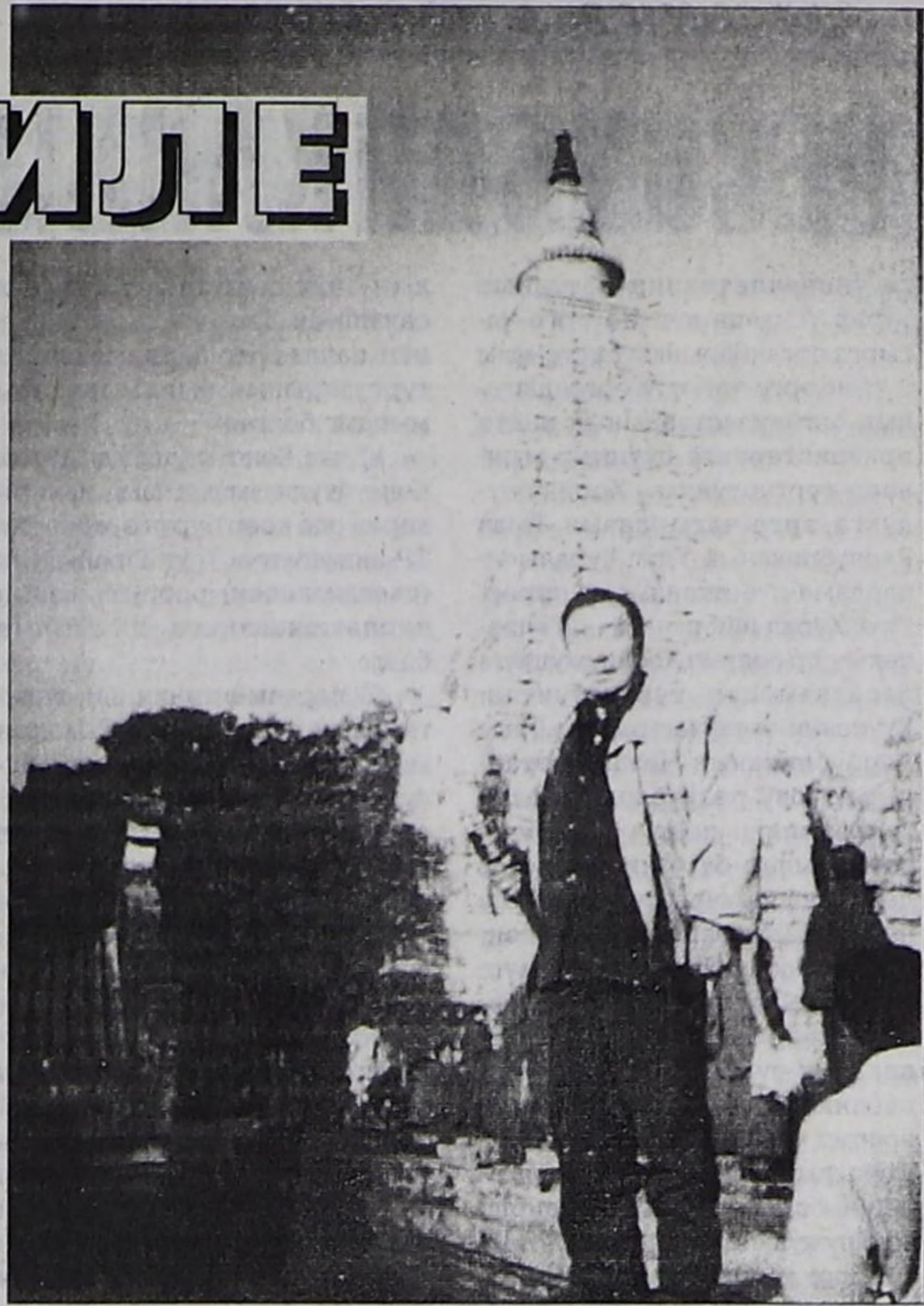
Будда бурганның Чырыткылыг угаан четкен черинде тургускан Субурган. 2003 чыл. Индияның Бодгайа хоорай.