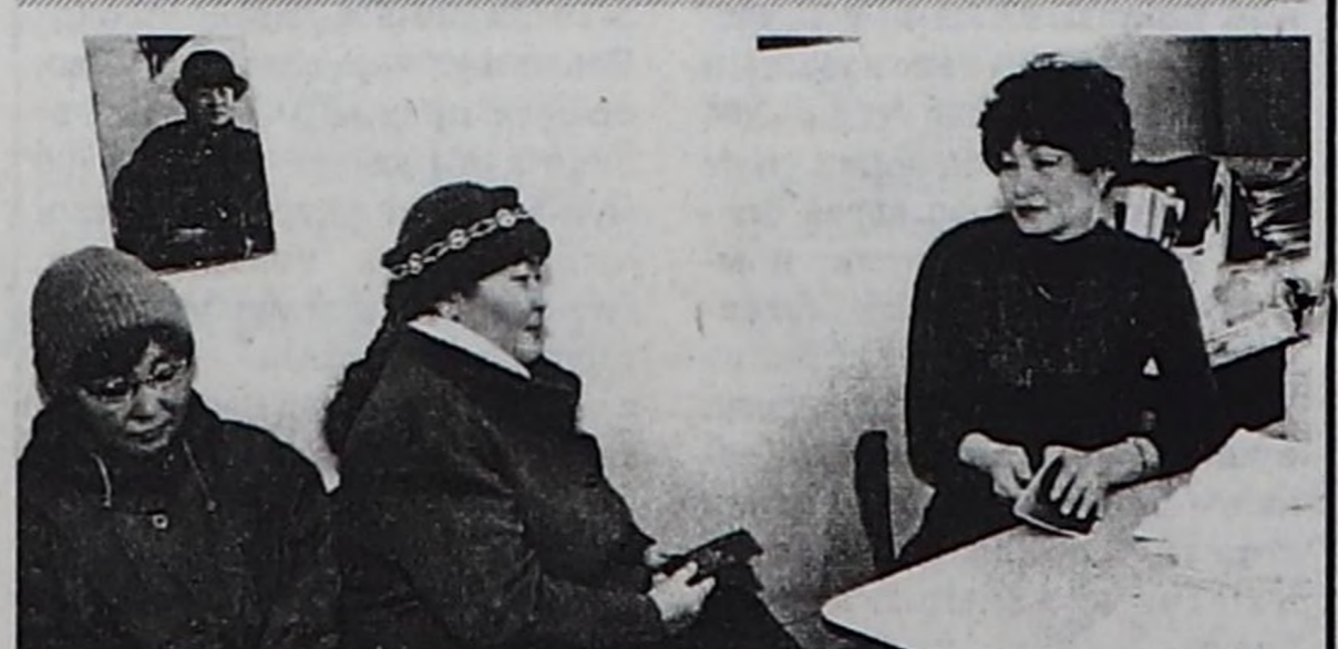
Талтун ажылдакчызы ажыл чок кижилер-биле чугааны кылып турары.

чарыгаттынган. Олар анай-хураган ажаажырынга, чаагай-жыдылгага, көдээ ажыл-агый база септелге ажылдарына, ногаалар үрезиннери тарыыр хааржактар кылырынга, хөрзүн белеткеп, олурткан үрезиннерни сугтарып ажаарына киришкенер. Оон түннелинде 37 тонна